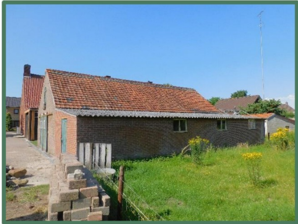
Te slopen aanbouw