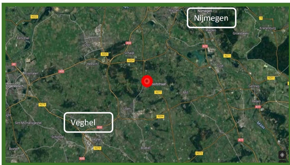
Satellietfoto omgeving plangebied, planlocatie is rood omcirkeld.

De ligging van het plangebied in de ruimere omgeving is weergegeven in onderstaande afbeelding.