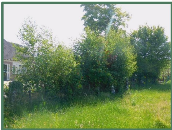
Vegetatie vanaf west