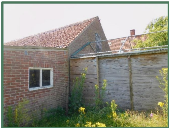
Aanbouw aan schuur