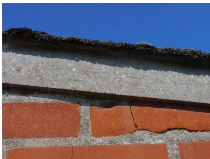
Aangemeerd dak op de zijgevels

Alle structuren waren goed toegankelijk en visueel goed te onderzoeken.