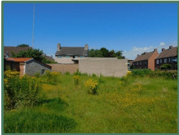
plangebied vanaf oost