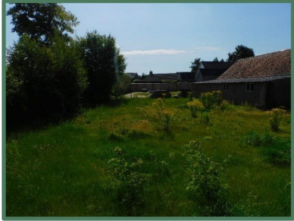
Plangebied vanaf west