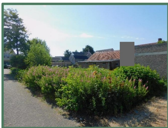
plangebied vanaf noordwest Rootstraat

De vegetatie bestaat uit planten, struiken en bomen waaronder spirea, brandnetel, appel, beuk, heder, krentenboompje, esdoorn, lijsterbes en vooral berk. Ook staat er op gemeentelijke grond een lindeboom. Het volledige plangebied bestaat uit een weiland met vooral Engels raaigras met daarbij onder andere robinia, jacobskruiskruid, klaver, paardenbloem, weegbree, dovenetel en vingerhoedskruid.