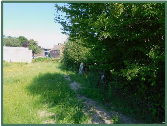
Vegetatie vanaf oost