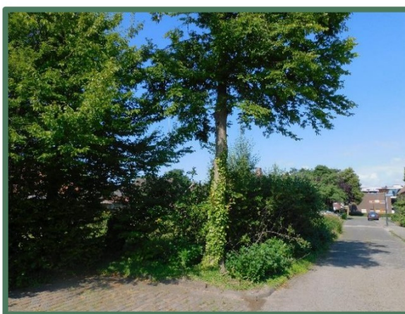
Plangebied vanaf noordoost Rootstraat

Het te slopen schuurtje betreft een aanbouw met een dak van golfplaten in lessenaarsdakvorm. De aanbouw is zijdelings aan een bijgebouw met pannendak behorend bij Puttelaar 19 aangebouwd. De muren zijn halfsteens gebouwd met rode bakstenen. De vloer is van beton. Het gebouwtje is niet geïsoleerd aan dak of muren en wordt gebruikt als opslagruimte. In de westgevel is een betonnen kozijn ingebouwd, aan de noordgevel drie en via een deur aan de oostgevel is het gebouw te betreden.