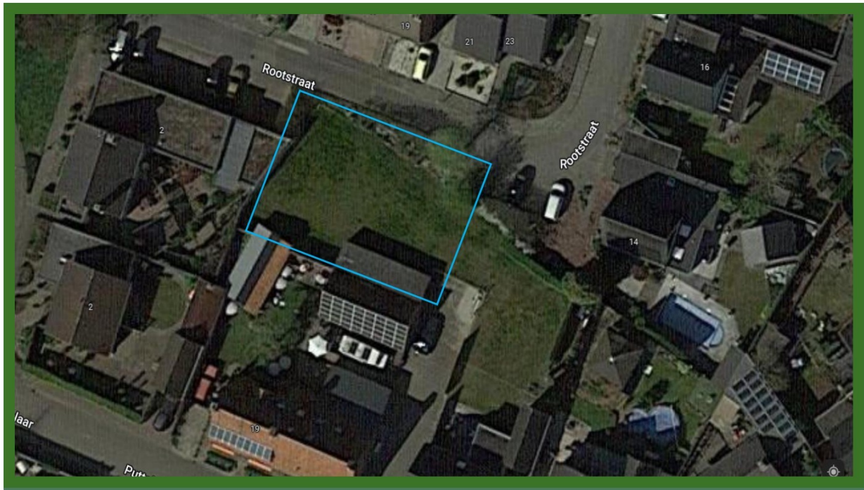
Globaal omliggende planlocatie in blauw.