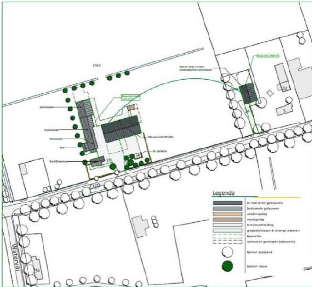
Uiteindelijk voorgestelde bouwvlak