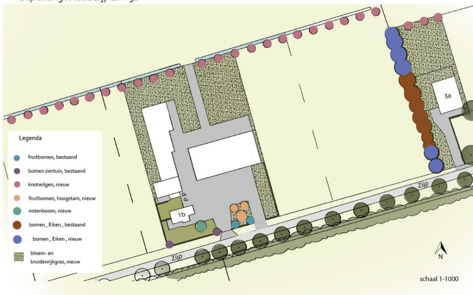
afbeelding: Bestaande en nieuwe beplanting.