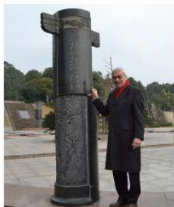
A法肯堡市長與法肯堡市長一行到李白故里參觀