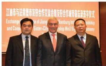
江油市與法肯堡市友好交流與簽署雙城友好合作城市備忘錄簽署儀式