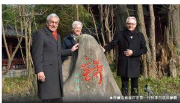
市長與法肯堡市長一行到李白故里參觀

西元八世紀出生的李白，享年六十二歲，生平經歷不詳，如今尚無確切的生卒年。他的詩歌存在於中國、日本、韓國、蒙古、越南的「詩歌」，如今在江油市李白故里上處處可見，也散佈在世界各地。印在李白紀念碑的詩及上地，更將印在法肯堡市長的心裡。