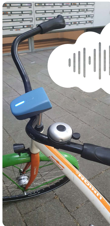
Metingen van de snuffelfietsen, zie https://aires.com/na-40-dagen-snuffelfietsen/