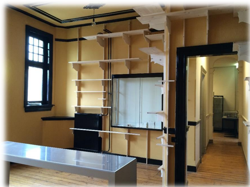
Impressie proefzaal 1ste verdieping