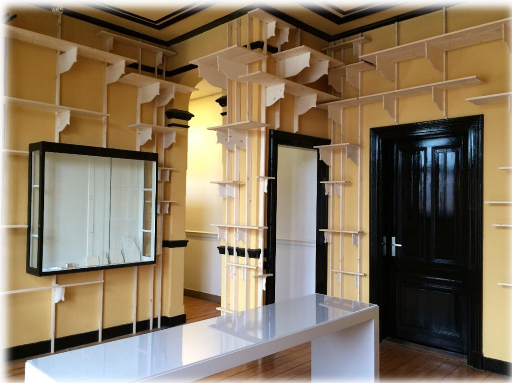
Impressie proefzaal 1ste verdieping

Fase 5: Promotie (sept 2017 – dec 2017) - NB. promotie van ontwikkelingen zal gedurende hele project Plaatsvinden