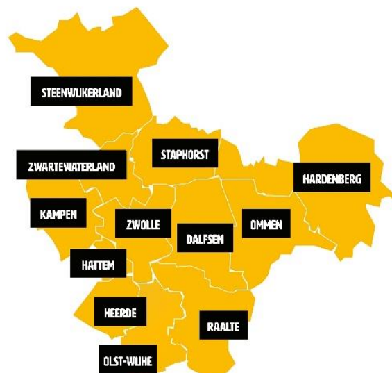
Figuur 1. Geografische weergave van de Leerplicht & Doorstroompuntregio IJssel-Vecht.

Dit Meerjarenbeleidsplan (MJB) is het beleidskader van onze regio. In dit document verwoorden de gemeenten in de regio hun gezamenlijke missie, visie, ambities en doelstellingen voor de beleidsperiode 2026-2030.