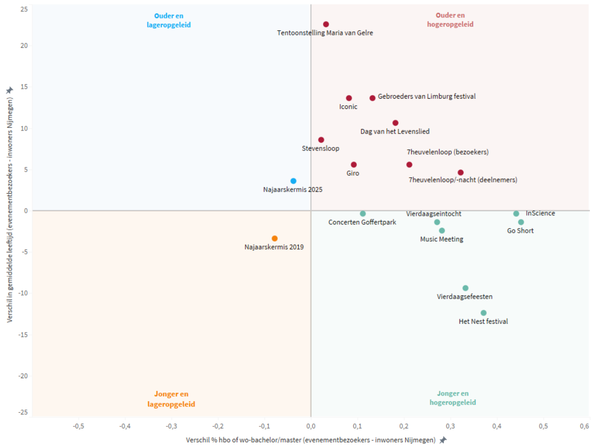
Bezoekersprofiel evenementen t.o.v. profiel inwoners van Nijmegen

Deze grafiek vergelijkt de bezoekers van evenementen met de inwoners van de stad op twee kenmerken: leeftijd en opleidingsniveau (% hbo/wo). Het nulpunt in het midden geeft aan dat de bezoekers hetzelfde profiel hebben als de gemiddelde stadsbevolking. De vier kwadranten tonen in hoeverre de bezoekers hiervan afwijken. De CBS-cijfers over het opleidingsniveau stammen uit 2024. De grootte van de bollen representeert het aantal bezoekers per evenement. De grafiek bevat gegevens van alle bezoekers, dus ook van die van buiten Nijmegen.