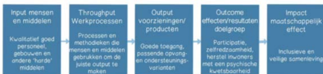
Figuur 4 Effectketen van Robbe, 2018

Samen met de ontwikkelagenda blijven beide uitvoeringsdocumenten de koers voor de komende jaren die gaande weg kan worden bijgestuurd op basis van de uitgangspunten in dit koersdocument, nieuwe ontwikkelingen, de ontwikkeling van de zorgvraag in de regio of nieuwe wet- of regelgeving.