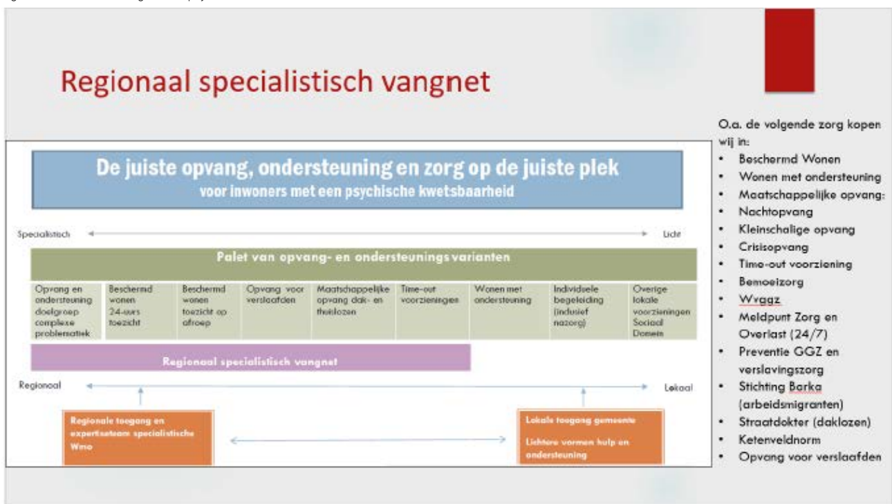
Figuur 3: Wmo-voorzieningen voor psychisch kwetsbare inwoners

Het regionale vangnet blijft beschikbaar voor de groep waarvoor een integrale lokale aanpak niet voldoende is en opvang en/of een beschermde woonomgeving noodzakelijk zijn. Vanuit de transformatiegedachte hangen het regionale vangnet en de lokale aanpak met elkaar samen. Het risico op een waterbedeffect is daarbij reëel: als het één niet op orde is (steunstructuren en basis op orde), wordt onnodig gebruik gemaakt van het ander (regionaal vangnet). Daarom richt de uitvoering van de Ontwikkelagenda zich op zowel de lokale- als regionale inspanningen die nodig zijn om de doelstellingen te bereiken, samen te leren en de samenwerking te versterken.