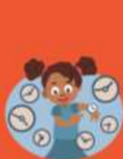
Neem de tijd voor me