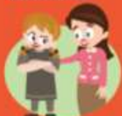
Neem mijn vertels