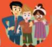
Zie de mensen om me heen