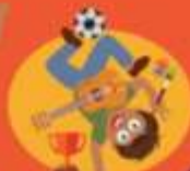
Zie mijn talenten