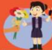
Waardeer me zoals ik ben