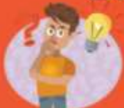
Denk met me mee