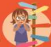
Help me kiezen