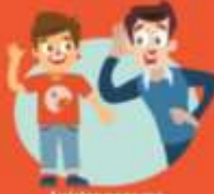
Luister naar me