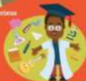
Bouw mee aan mijn toekomst