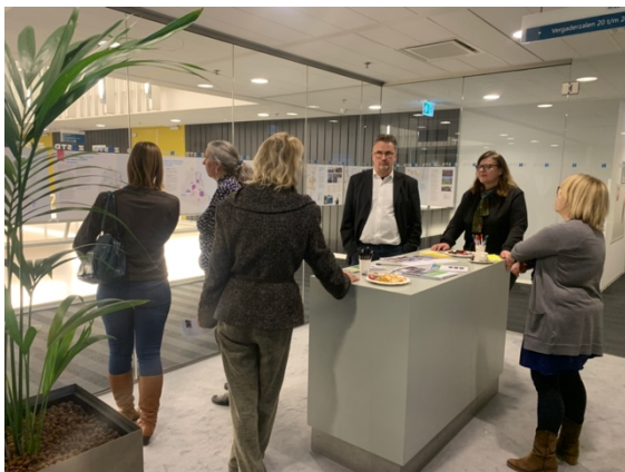
Inloopmoment voor de raad

Het eerste participatiemoment dat werd georganiseerd na de vrijgave was een inloopbijeenkomst voor raadsleden op het stadhuis. Deze bijeenkomst werd georganiseerd voorafgaand aan het Zaanstad Beraad op de donderdagavond. De aanpak voor deze bijeenkomst was vergelijkbaar met de aanpak voor de ambtelijke inloopmomenten: de inhoud van het werkboek werd getoond op posters verspreid over de ruimte. Ook lagen er inkijkexemplaren van het Werkboek om doorheen te bladeren. Bij deze bijeenkomst werd de parkeerdruk in Noord en het vergroenen van het Marktpllein in Wormerveer als aandachtspunten benoemd.