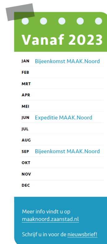
Planning van de jaarlijkse participatiebijeenkomsten van MAAK.Noord

Naast fysieke bijeenkomsten zetten we ons ook in om de online participatie te versterken. Hiermee geven we gehoor aan de vraag vanuit de bewoners en ondernemers van Noord om een integraal en actueel overzicht te bieden van alle ontwikkelingen binnen Noord en de mogelijkheid om online hierover mee te denken. Zo hopen wij nog meer mensen binnen Zaanstad Noord te bereiken.