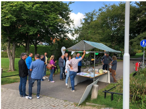
Expeditie Zaanstad Noord

Daarnaast deden studenten van de Hogeschool van Amsterdam tijdens de Expeditie onderzoek naar participatie in Zaanstad. Bestuurders van de gemeente zijn met de studenten in gesprek gegaan over de resultaten. Team Erfgoed van de gemeente Zaanstad deed onderzoek naar de beleving van Noord. Dit onderzoek vond zowel tijdens de gesprekken op straat als online plaats. Deze resultaten zijn verwerkt in het speerpunt over cultuurhistorie en natuur. De gemeenteraad was ook aanwezig: zij fietsten langs een aantal locaties waar ze in gesprek gingen over MAAK.Noord.