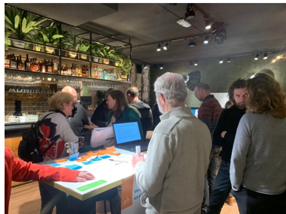
Bijeenkomst voor bewoners en ondernemers