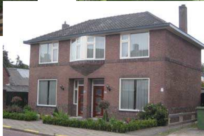
Bestaande lint Molenstraat/Dreefstraat