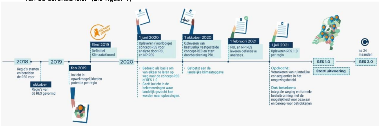
Figuur 1 tijdspad Regionale Energiestrategie

In een Regionale Energiestrategie (RES) beschrijft elke energieregio zijn keuzes. Valkenburg aan de Geul werkt met de 15 andere Zuid-Limburgse gemeenten samen in de RES regio Zuid-Limburg. Deze RES is weer onderverdeeld in de drie subregio's Maastricht-Heuvelland, Parkstad en Westelijke Mijnstreek. Inmiddels is de formele planning van het RES traject landelijk aangepast onder invloed van de coronacrisis. (zie figuur 1)