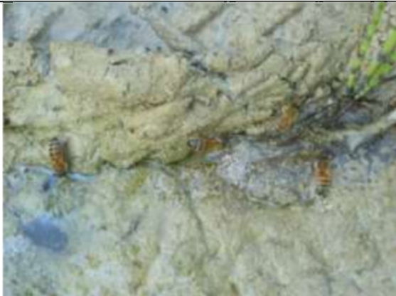
26/07, drinkende honingbijen , Natuurtuin Rijswijk, Anna Kreffer.