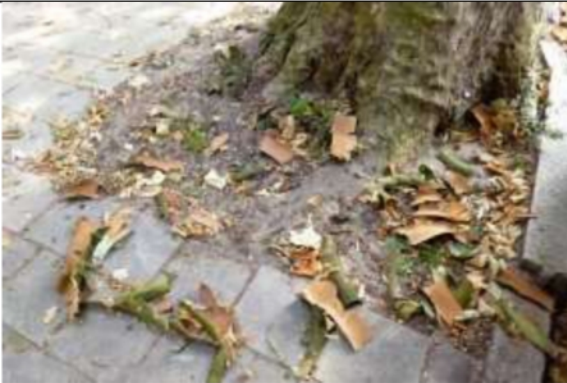
22/07, plataanschors , Balistraat, Jos van Koppen.