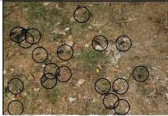
24/07, 18 drollen , Wilhelminapark, ingang Westplantsoen, Margreet Hogeweg.