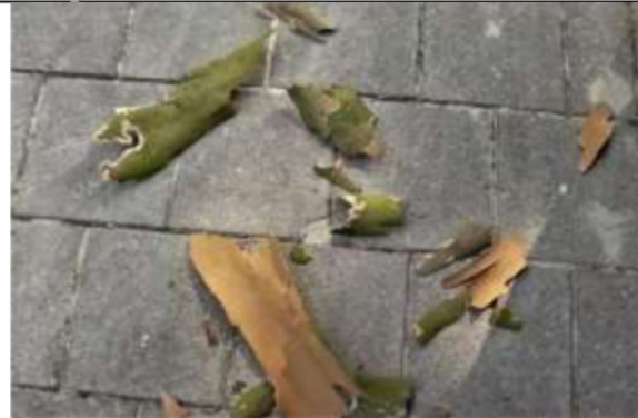
22/07, plataanschors , Balistraat, Jos van Koppen.