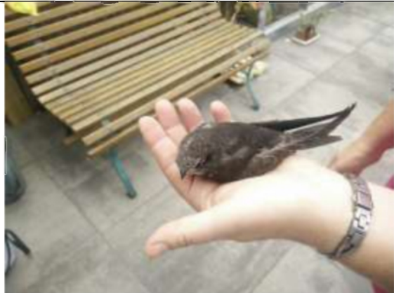
28/07, gierzwaluw , uit het nest gevallen, Yvonne van Rijn.