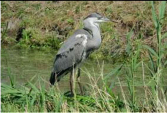
17/07, jonge blauwe reiger , Vlaardingervaart, Aad van Uffelen.