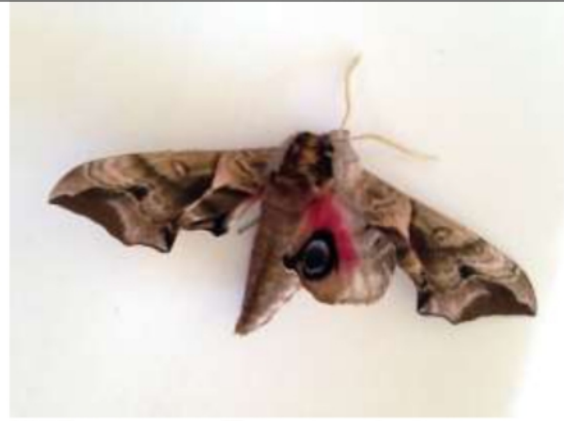
07/07, pauwoogpijlstaart , op de deurmat van Annalies.