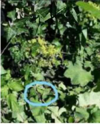
01/07, eikenpage , kruidtuin Staelduinsebos Huub van 't Hart.