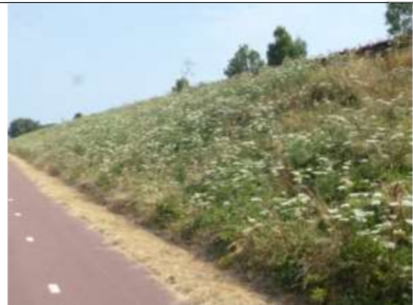
Berm met gewone berenklaauw