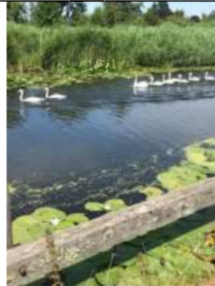
22/07, knobbelzwanen , Maassluis, Bruun vd Steuijt.