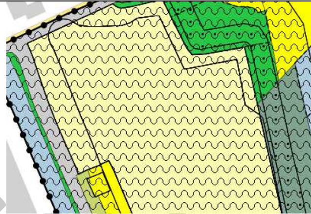
Uitsnede ontwerpbestemmingsplan 2018

Dwars door het gebied ligt van noord naar zuid een gasleiding. Op deze gasleiding en delen aangrenzend aan de leiding, mag niet worden gebouwd. Dit is de zogeheten belemmeringsstrook. In het ontwerp van 2016 zijn deze gronden bestemd voor Tuin-2 en in het ontwerp van 2018 zijn deze gronden bestemd als Natuur met een dubbelbestemming voor Leidingen. In beide gevallen is bepaald dat deze gronden niet bebouwd mogen worden. De gronden met de bestemming Natuur, worden in zijn geheel niet uitgegeven, maar ingericht als ecologische verbindingzone. Hoewel dit ten koste gaat van uitgeefbare grond, komt dit wel de kwaliteit van het plangebied en daarmee de woonomgeving van de toekomstige bewoners ten goede. Indien er wordt dan ook niet onevenredig geschaad door vermindering van het uitgeefbare gebied.