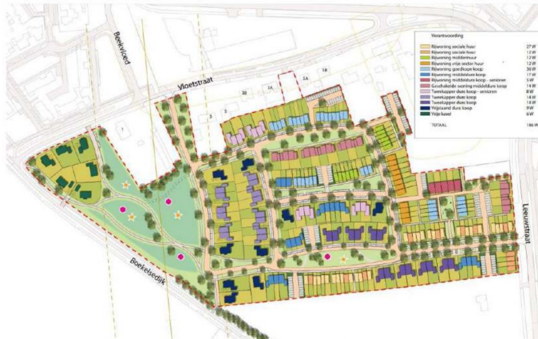
Figuur 1.2: Verkaveling

Het akoestisch onderzoek is noodzakelijk omdat het plan is gelegen binnen de geluidzone van de N264, Nieuwe Udensweg, Leeuwstraat en Boekelsedijk. In het kader van een goede ruimtelijke ordening zijn de Vloetweg en Beekvloed opgenomen in het akoestisch onderzoek.