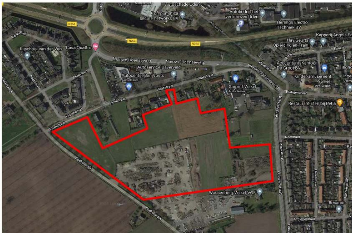
Figuur 1.1: Situatie

In figuur 1.1 is de locatie globaal omcirkeld, in bijlage I is de situatie opgenomen. In figuur 1.2 is de verkaveling van het plangebied opgenomen.