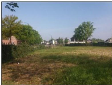
Figuur 3. Overzicht onderzoekslocatie vanuit zuiden gezien.