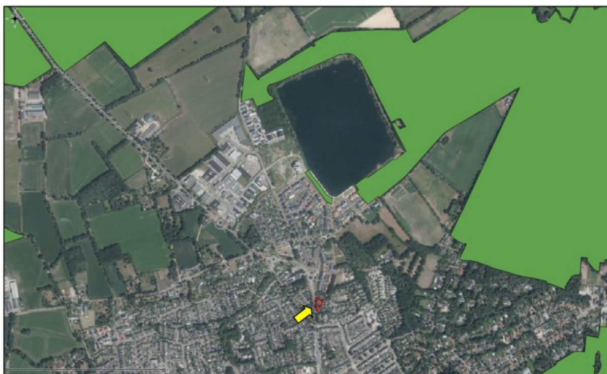
Figuur 8. Ligging onderzoekslocatie ten opzichte van het Natuurnetwerk Nederland.

De onderzoekslocatie maakt geen deel uit van het Natuurnetwerk. In figuur 8 is de ligging van de onderzoekslocatie ten opzichte van het Natuurnetwerk Nederland weergegeven. Echter is een deel van dit Natuurnetwerk in 2017 opgeheven en wordt dit gebied elders gecompenseerd (zie figuur 9). Het meest nabijgelegen gebied van het Natuurnetwerk bevindt zich nu circa 575 meter ten oosten van de onderzoekslocatie. Het betreft 'Droog bos met productie'. Door de voorgenomen plannen op de onderzoeklocatie in combinatie met de afstand, zullen de wezenlijke kenmerken en waarden van het Natuurnetwerk Nederland derhalve niet worden aangetast. Vervolgonderzoek in het kader van het Natuurnetwerk Nederland wordt niet noodzakelijk geacht.