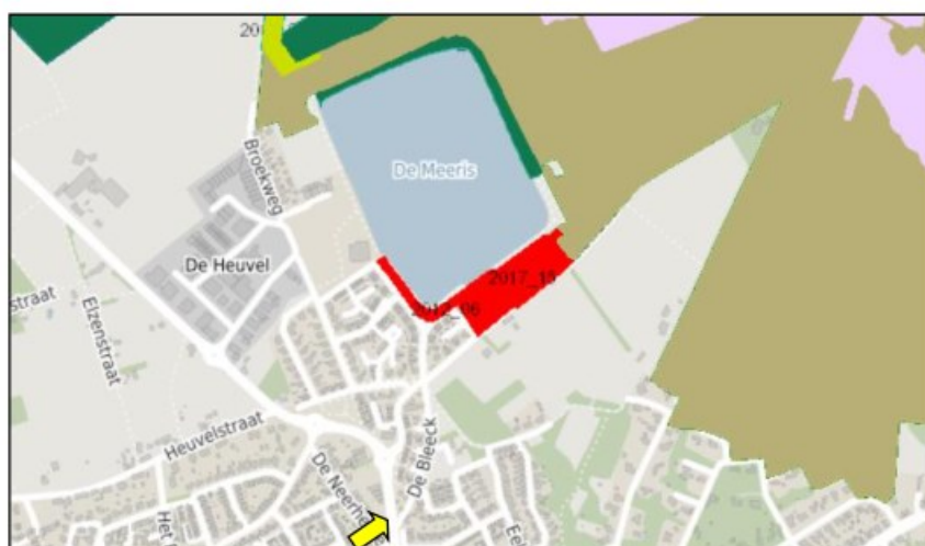
Figuur 9. Opgeheven gedeelte van het Natuurnetwerk in rood aangeduid.