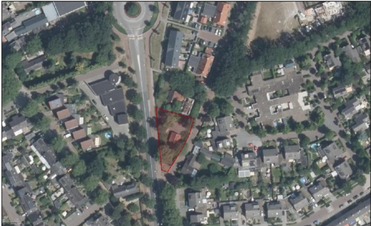
Figuur 2. Luchtfoto onderzoekslocatie en directe omgeving.