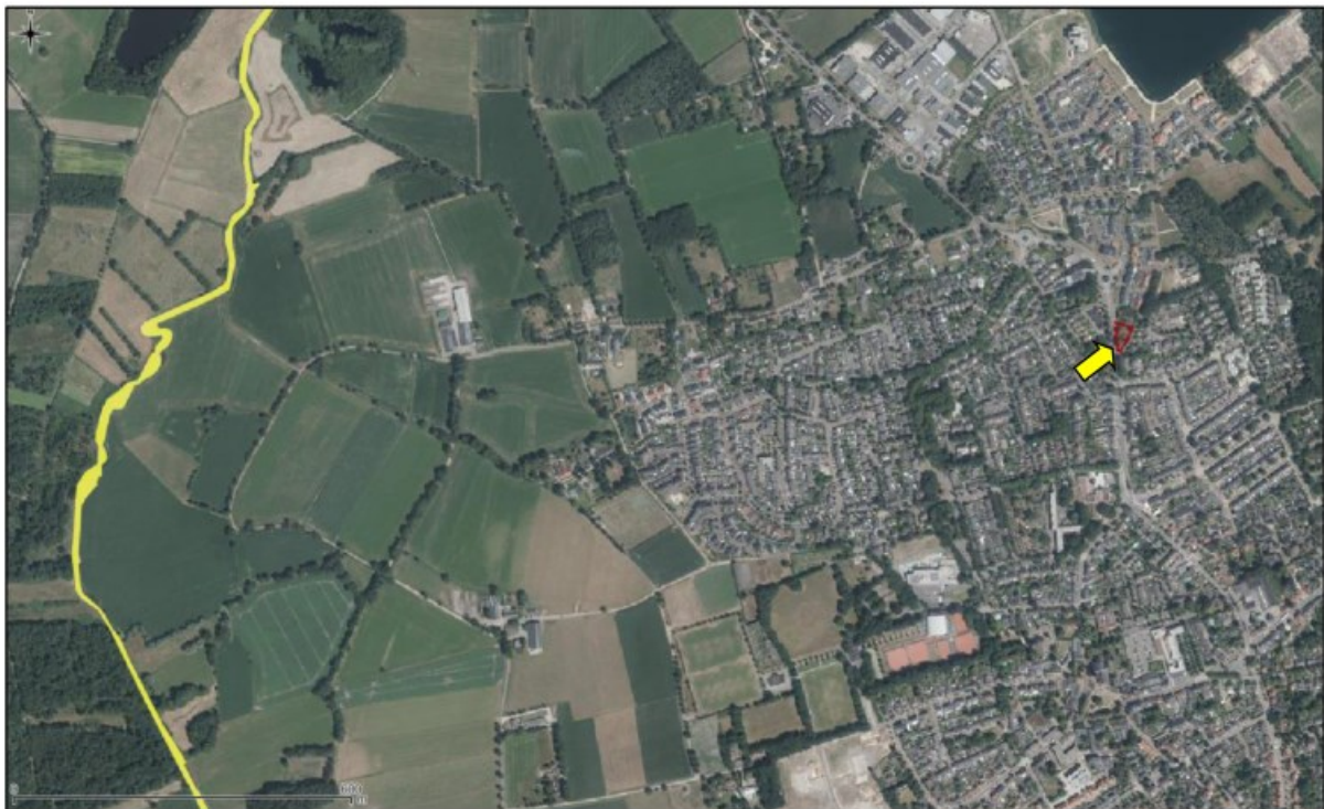
Figuur 7. Ligging onderzoekslocatie ten opzichte van Natura 2000.

De onderzoekslocatie is niet gelegen binnen de grenzen, of in de directe nabijheid van een gebied dat aangewezen is als Natura 2000. Het meest nabijgelegen Natura 2000-gebied, 'Leenderbos, Groote Heide & De Plateaux', bevindt zich op circa 1,6 kilometer afstand ten westen van de onderzoekslocatie (zie figuur 7).