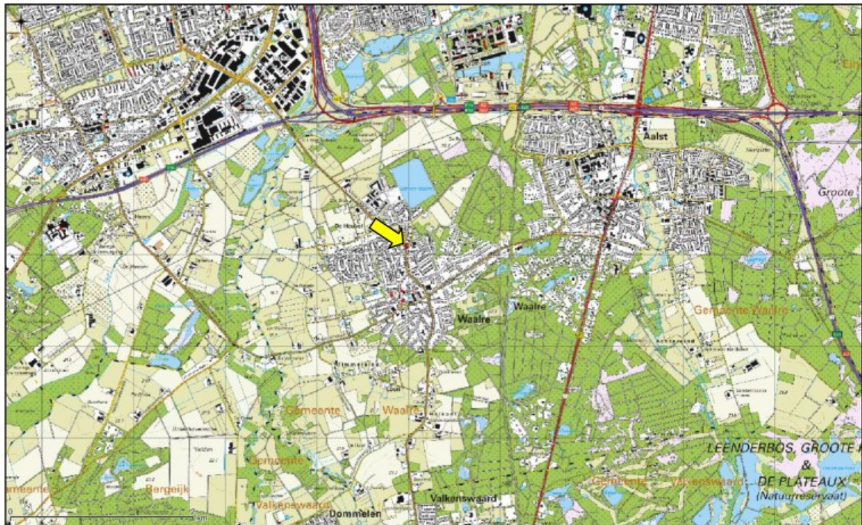
Figuur 1. Topografische ligging van de onderzoekslocatie.

Volgens de topografische kaart van Nederland zijn de coördinaten van het midden van de onderzoekslocatie X = 158.976 ; Y = 378.089 .