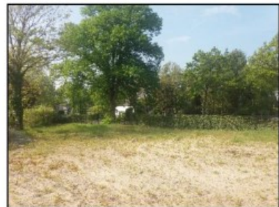
Figuur 5. Overzicht onderzoekslocatie vanuit noorden gezien.