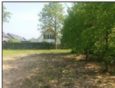
Figuur 4. Onderzoekslocatie met bomenrij langs de oostzijde.