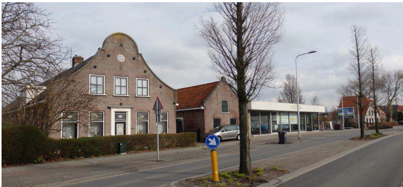
Monumentale boerderij aan westzijde bouwplan Wittebrug