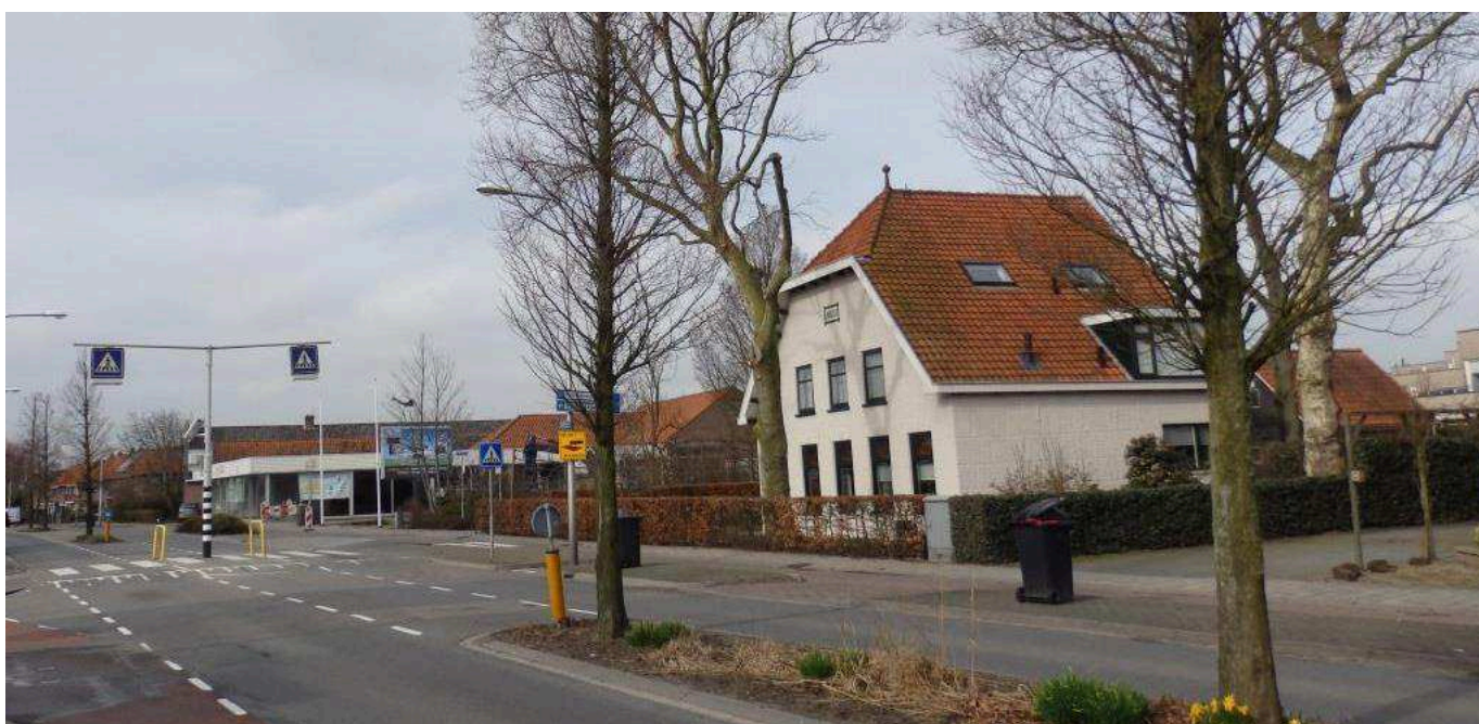
Oude monumentale boerderij ten oosten van bouwplan Wittebrug