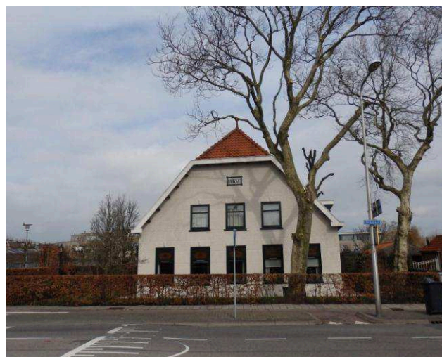
De beide monumentale boerderijen aan resp. west- en oostzijde van het bouwplan Wittebrug.