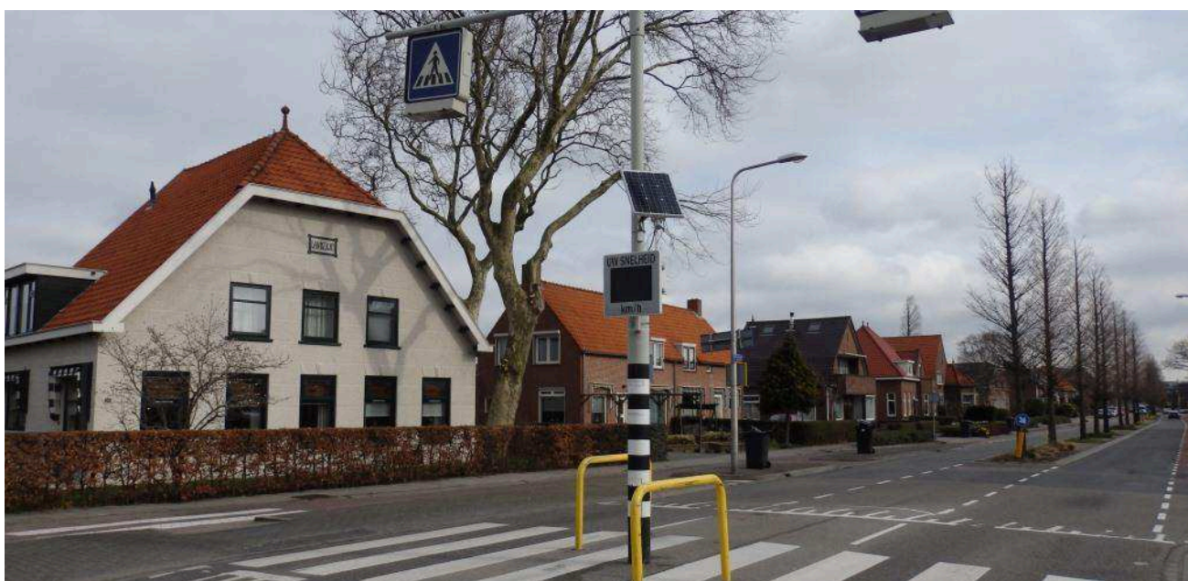
Woningen aan de zuidzijde van de Kerkstraat; ten oosten van het bouwplan Wittebrug