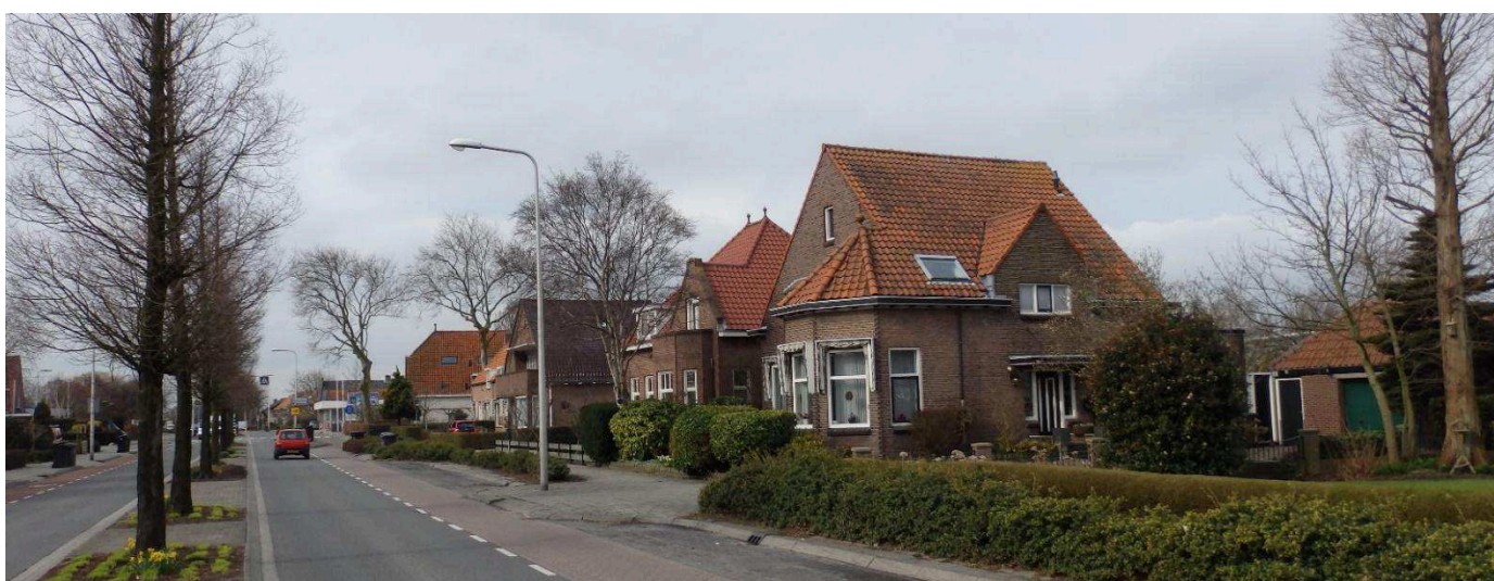
Woningen aan de zuidzijde van de Kerkstraat; ten oosten van het bouwplan Wittebrug