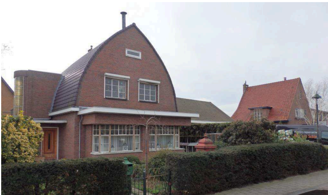
Woningen aan noordzijde Kerkstraat tegenover bouwplan Wittebrug