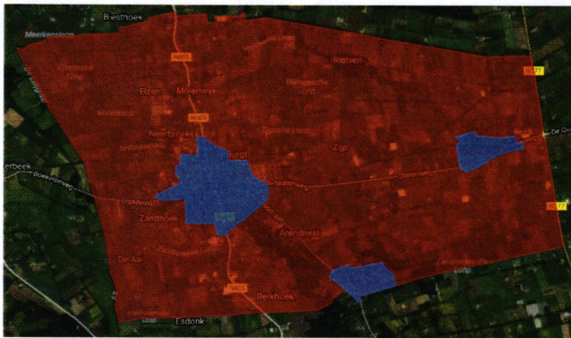
Huidige grenzen bebouwde kom