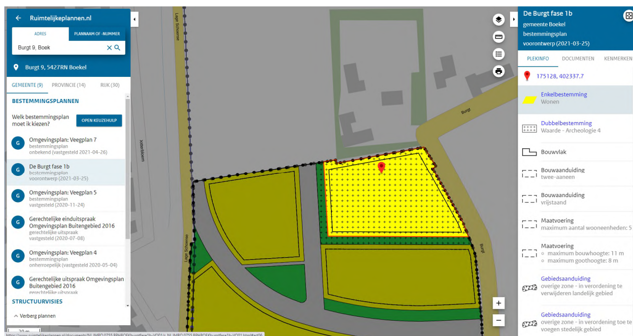
Afbeelding 1 Ligging van perceel Burgt 9 in bestemmingsplan 'Burgt fase 1b'

Voor het plangebied 'Burgt fase 1b' is in oktober/ november 2020 archeologisch booronderzoek uitgevoerd. Onlangs is duidelijk geworden dat het perceel 'Burgt 9' bij fase 1b van het project betrokken wordt. In het rapport van het onderzoek uit november 2020 staat het volgende over het perceel direct ten zuiden van Burgt 9.