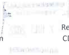
René Segers-Hoogendoorn CDA Rotterdam