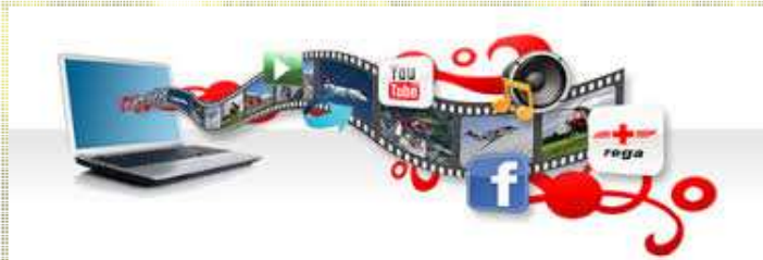
website en app