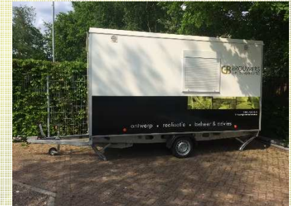
mobiel, 6x per jaar