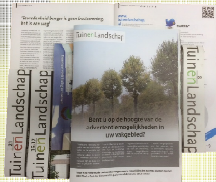
landelijk, 2x per jaar