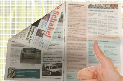
de Schakel, 1x per