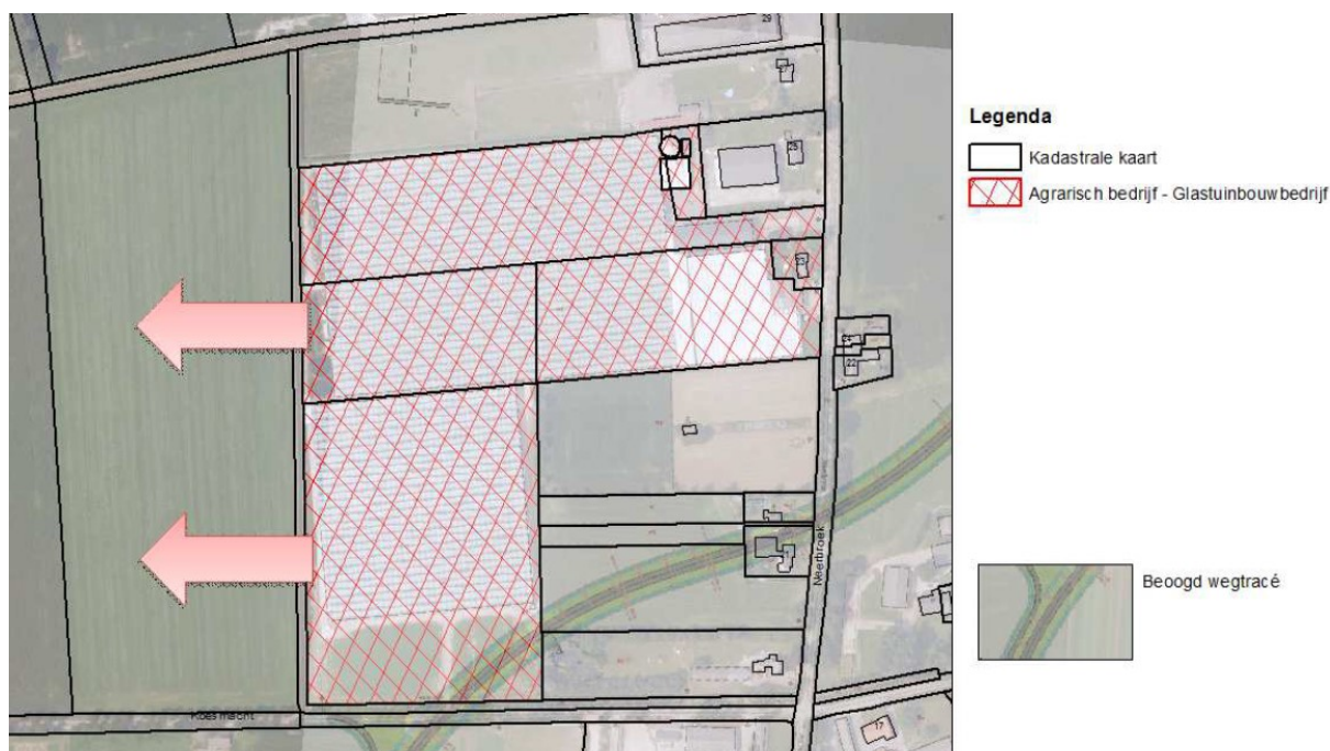
Figuur 1. Beoogde uitbreidingsrichting Neerbroek 23a.

Voor de locatie Neerbroek 23a is nadrukkelijk ook meegewogen dat ter plaatse de realisatie van de randweg Boekel over het bestaande bouwvlak van dit bedrijf heen is geprojecteerd. Ter plekke beschikt de ondernemer over een direct uitvoerbare bouwvergunning voor het oprichten van kassen. De realisatie hiervan is door betreffende ondernemer uitgesteld na overleg met de gemeente, lopende het traject rondom de randweg. Ook de overige uitbreidingsruimte uit de visie van 2006 ligt (deels) op het tracé van de randweg. Uitbreiding in een andere richting, naar het westen, is nodig ter compensatie van bestaande mogelijkheden.