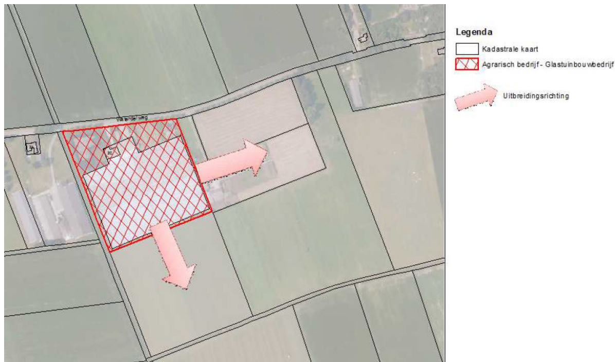
Figuur 4. Beoogde uitbreidingsrichting Waterdelweg 2c.