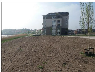
Figuur 3. Overzicht onderzoekslocatie naar zuiden bezien.