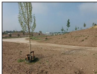
Figuur 4. Toegangsweg onderzoekslocatie.