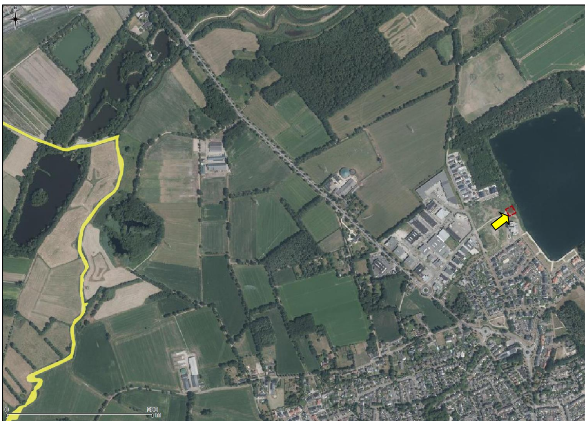
Figuur 6. Ligging onderzoekslocatie ten opzichte van Natura 2000.

De onderzoekslocatie is niet gelegen binnen de grenzen, of in de directe nabijheid van een gebied dat aangewezen is als Natura 2000. Het meest nabijgelegen Natura 2000-gebied, 'Leenderbos, Groote Heide & De Plateaux', bevindt zich op circa 1,3 kilometer afstand ten westen van de onderzoekslocatie (zie figuur 6).