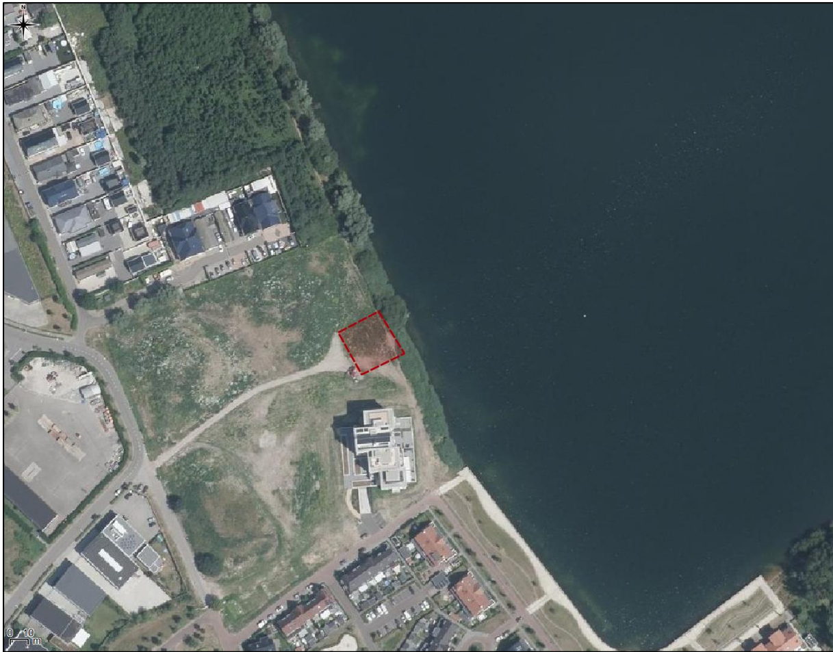
Figuur 2. Luchtfoto onderzoekslocatie en directe omgeving.