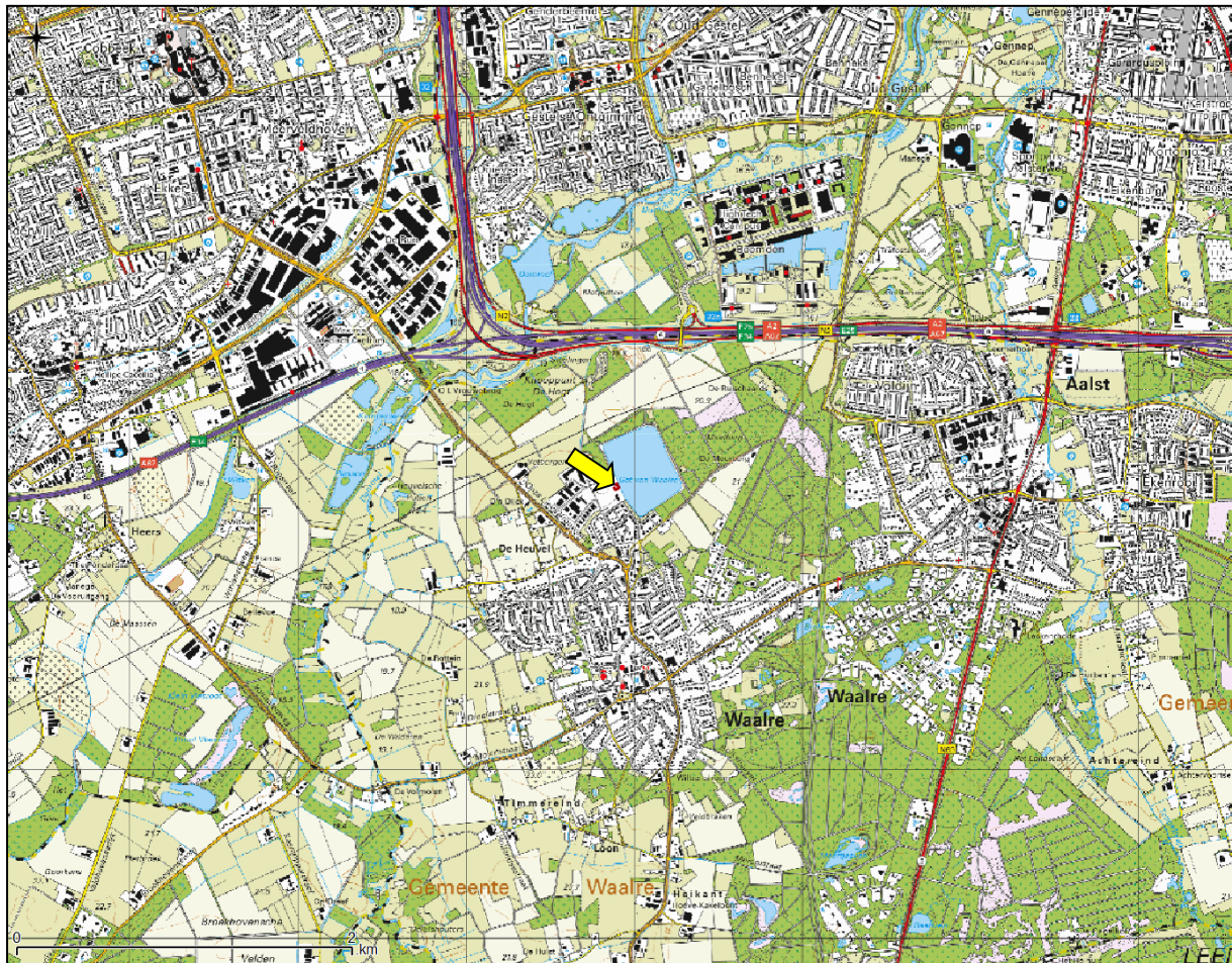
Figuur 1. Topografische ligging van de onderzoekslocatie.

Volgens de topografische kaart van Nederland zijn de coördinaten van het midden van de onderzoekslocatie X = 158.892 ; Y = 378.679 .