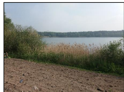
Figuur 5. Oeverrand en gedeeltelijk onderdeel van de onderzoekslocatie.