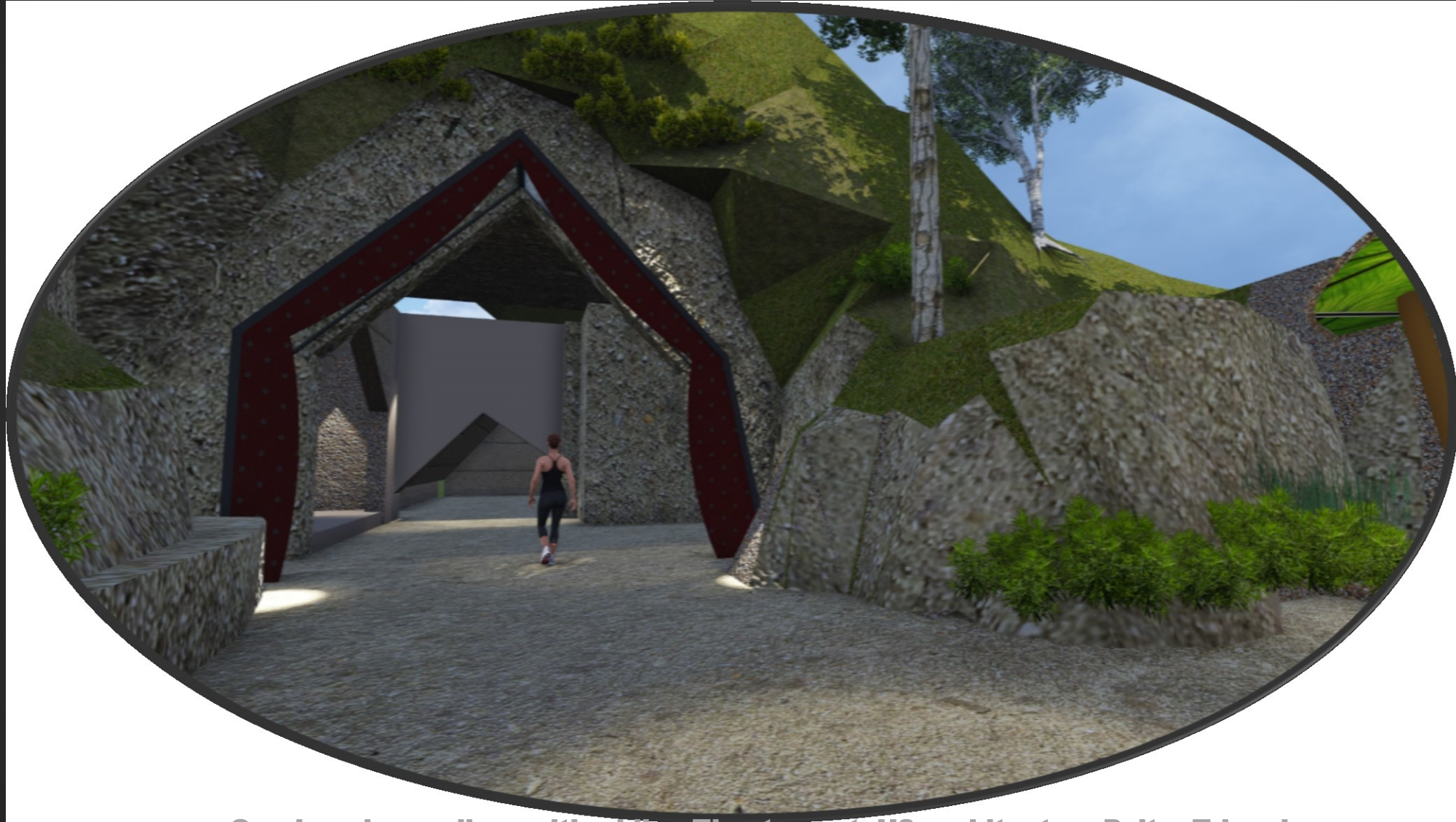
Overkapping podium, uitbreiding Theatergrot, H3 architecten, Palte, Trimmings.