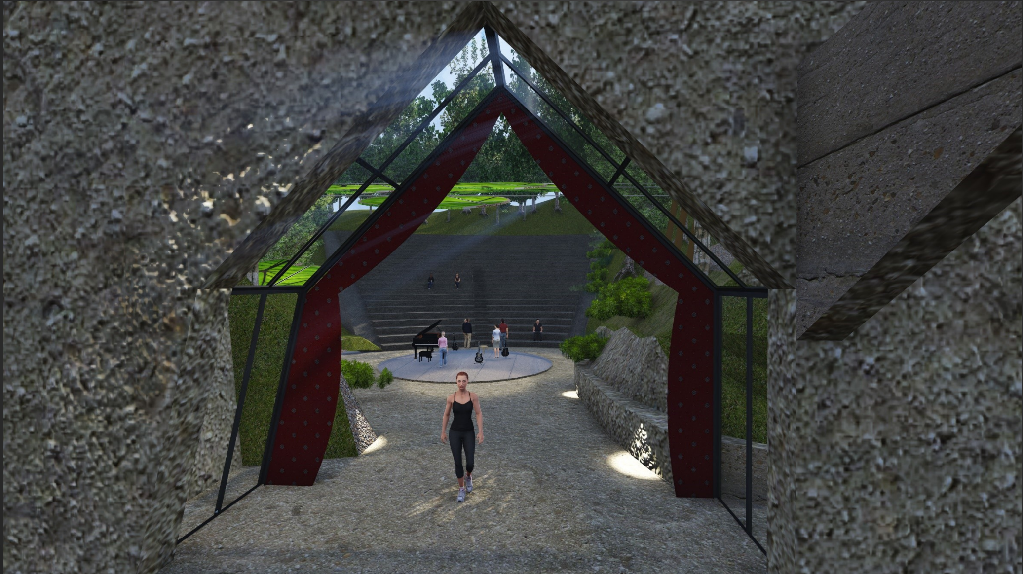
Overkapping podium, uitbreiding Theatergrot, H3 architecten, Palte, Trimmings.