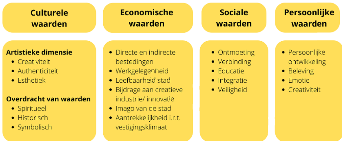
Figuur 4. Waarden van cultuur volgens Cees Langeveld in zijn proefschrift 'De economie van Theater'