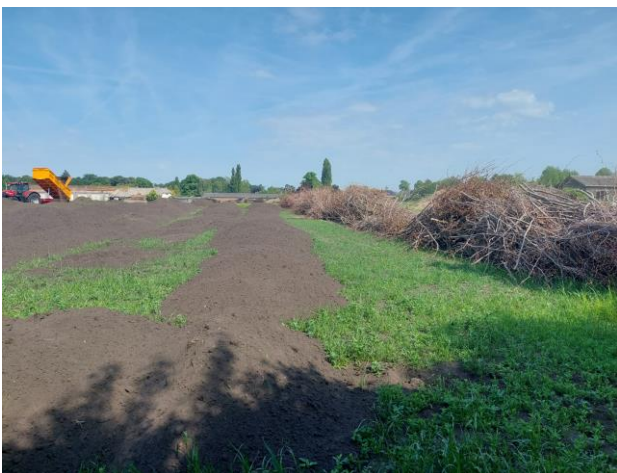
Aanbrengen hoogteverschil, snoeiafval wordt circulair gebruikt om een afscheiding te maken van het perceel.

Eind mei zijn er grote stappen gezet met de grondbewerking, de vroegere hoogteverschillen zijn terug gebracht en de poelen zijn gegraven.