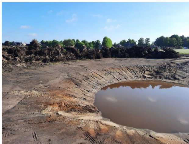
Gegraven poel, de boomstobben op de foto zijn de stobben van de gekapte bomen aan de Burgt fase 1a. Deze dienen straks als schuilgelegenheid voor insecten en kleine zoogdieren.