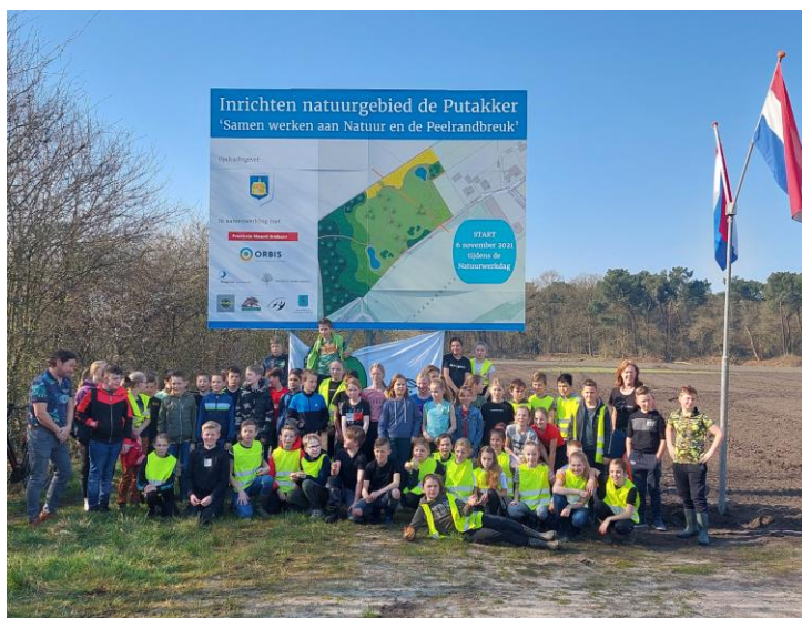
Leerlingen hebben in groepjes geholpen met de aanplant van boompjes en struweel. Stichting d'n Eik heeft ook uitleg gegeven over het bijzondere verschijnsel 'de Peelrandbreuk'.

De vrijwilligers van stichting d'n Eik hebben het struweel van de vogelbosjes verder aangeplant, ze hebben alles aangeplant conform de ontwerptekening.