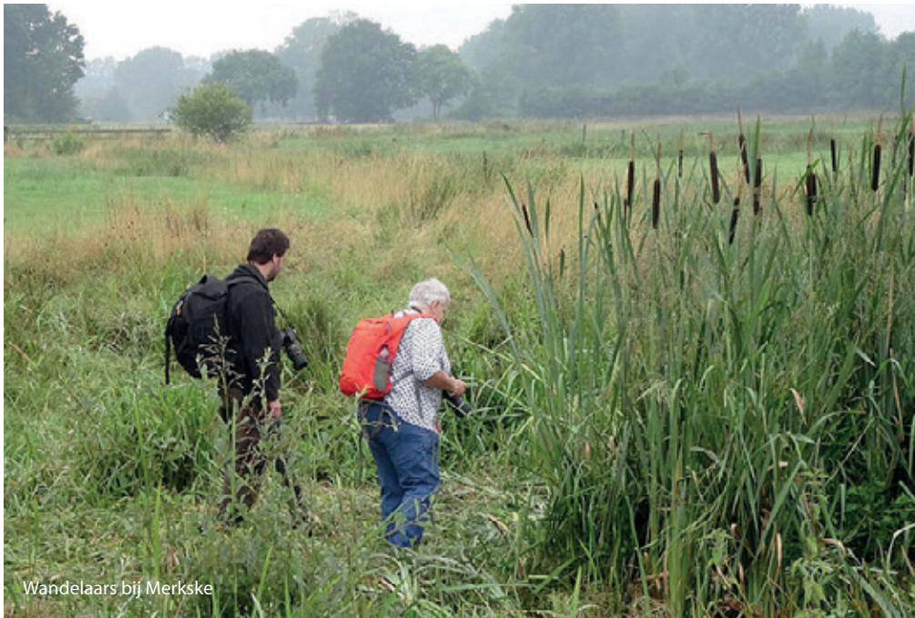
Wandelaars bij Merkske