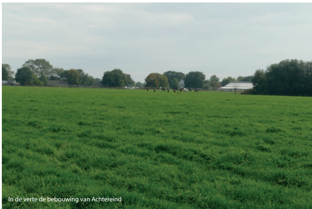
In de verte de bebouwing van Achtereind