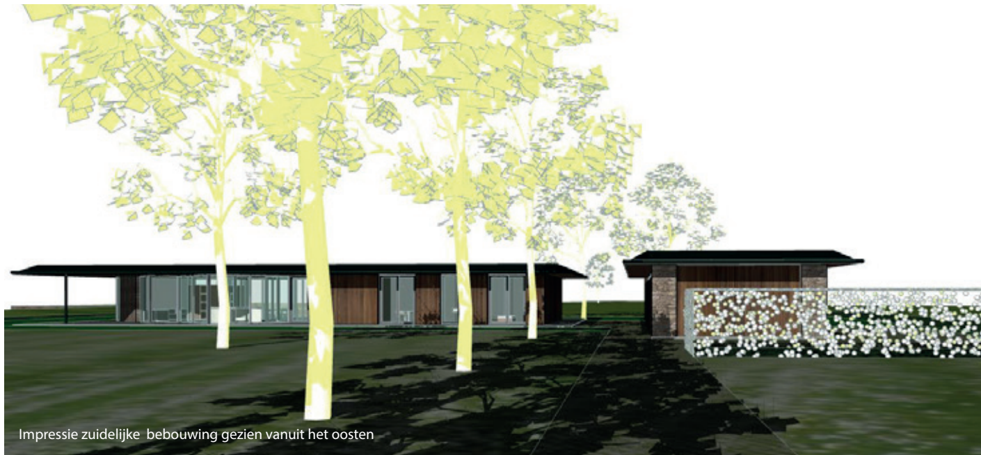
Impressie zuidelijke bebouwing gezien vanuit het oosten