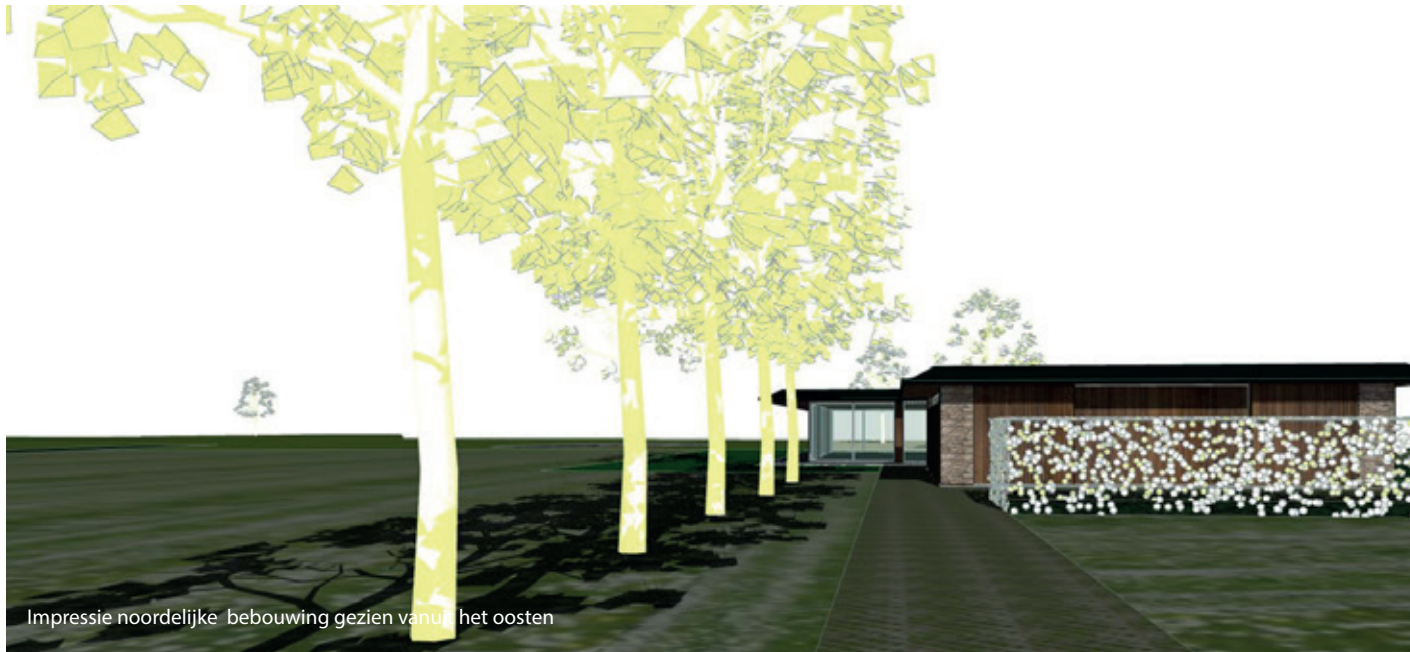
Impressie noordelijke bebouwing gezien vanuit het oosten