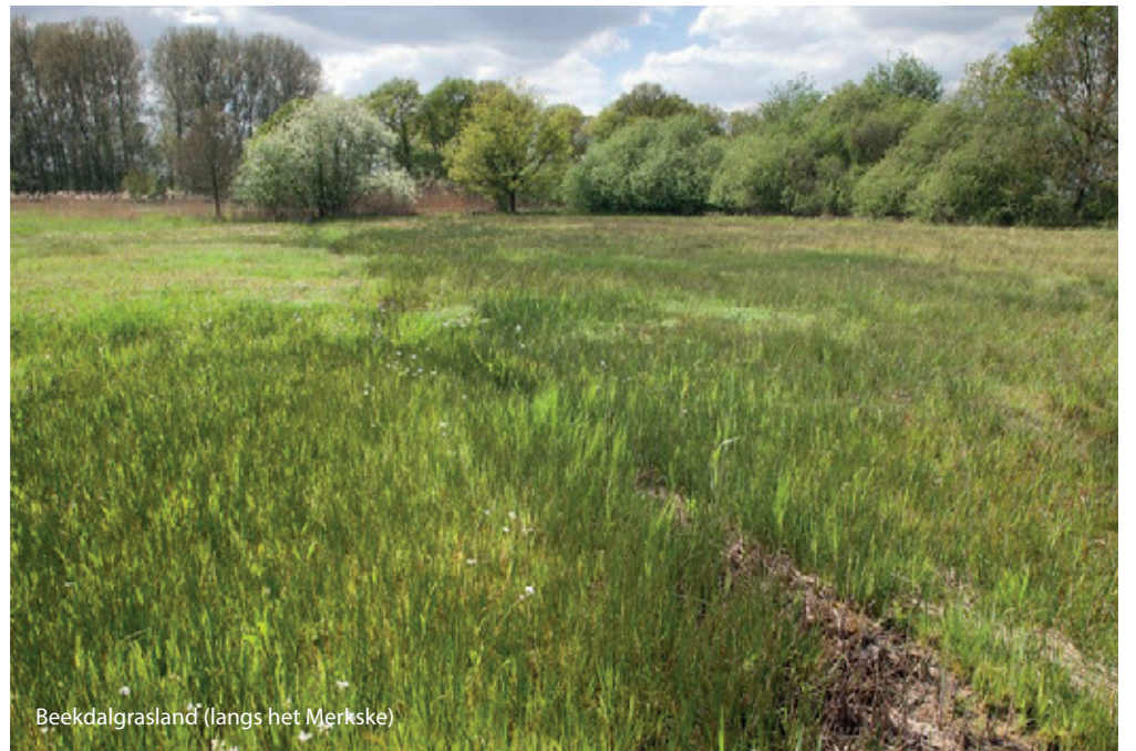
Beekdalgrasland (langs het Merkske)