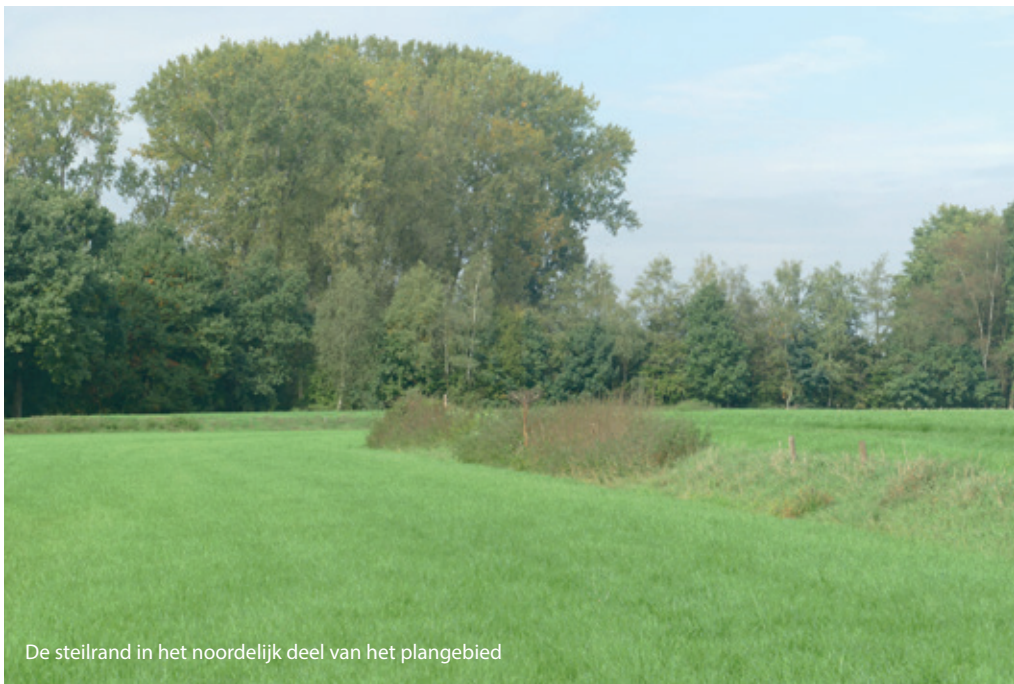
De steilrand in het noordelijk deel van het plangebied