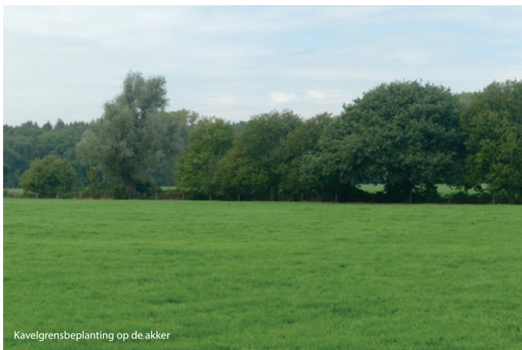
Kavelgrensbeplanting op de akker