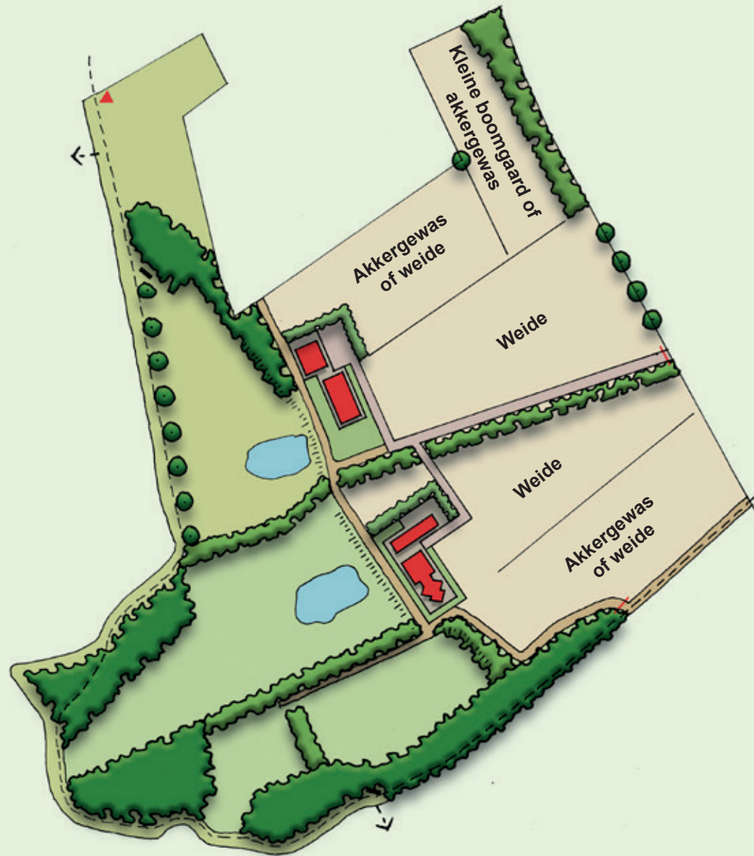
Mogelijke invulling landbouwgrond bij Ondernemend Natuurnetwerk Brabant