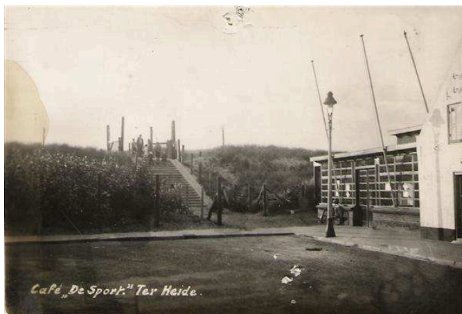
Ter Heijde ca. 1900 Strandopgang Karel Doormanweg