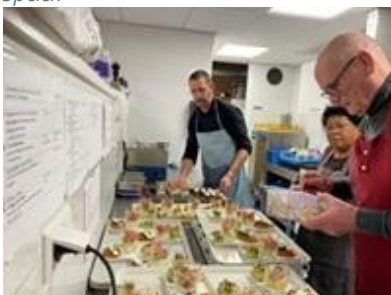
Koken voor gasten