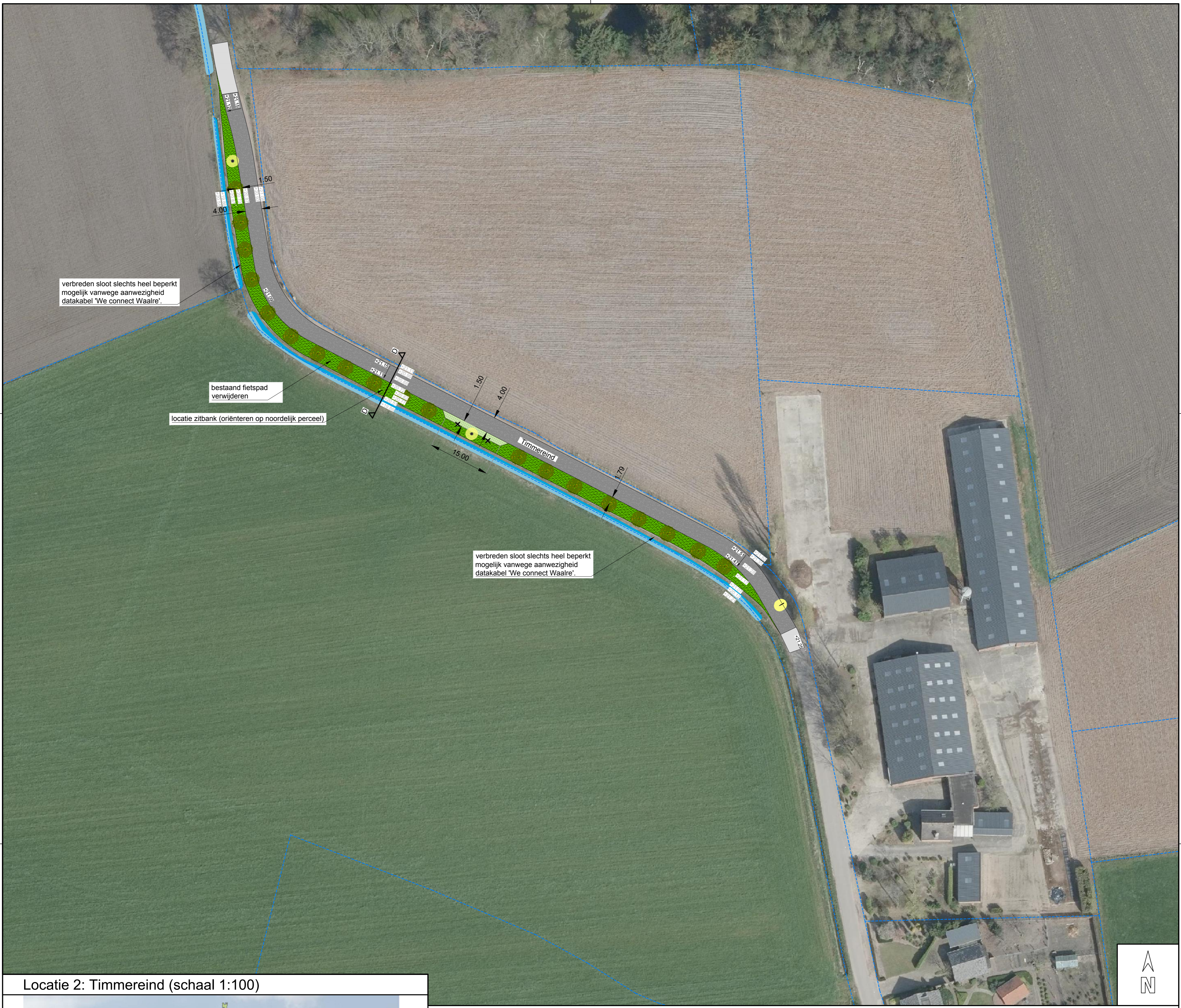
Locatie 2: Timmereind (schaal 1:100)