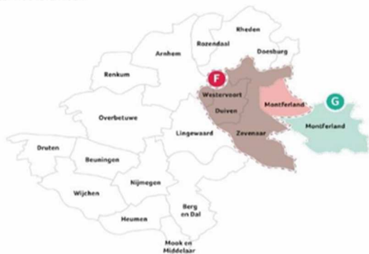
PERCELEN ROUTEVERVOER (F, G)