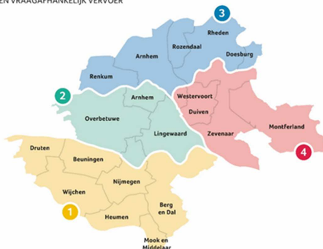
PERCELEN VRAAGAFHANKELIJK VERVOER

Één vervoerder heeft na de initiële periode afgezien van verdere verlengingsopties, waardoor het vervoer binnen het perceel Oost in 2024 opnieuw is aanbesteed. Voor dit perceel is een looptijd afgesproken van 10 jaren (tot medio 2034), waarvan 6 jaren initieel en 2 x 2 jaren verlengingsopties met startdatum 1 augustus 2024.