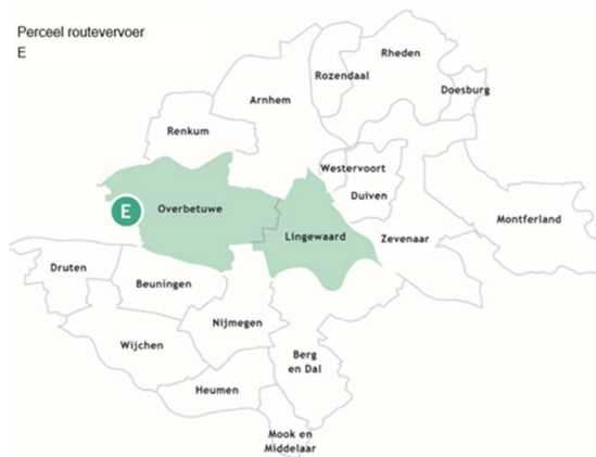
Perceel routevervoer E