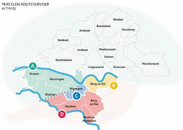
PERCELEN ROUTEVERVOER (A t/m D)