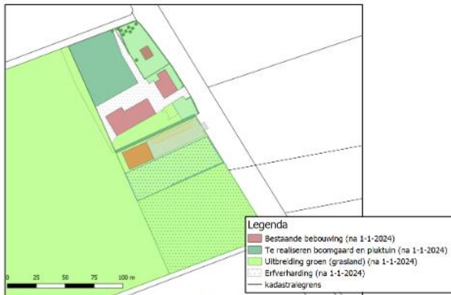
Afbeelding 7: Toekomstige situatie na 1 januari 2024