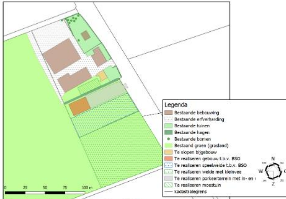
Afbeelding 6: Toekomstige situatie tot 1 januari 2024

Op navolgende afbeelding worden de toekomstige situaties (tot 1 januari 2024 en na 1 januari 2024) weergegeven.