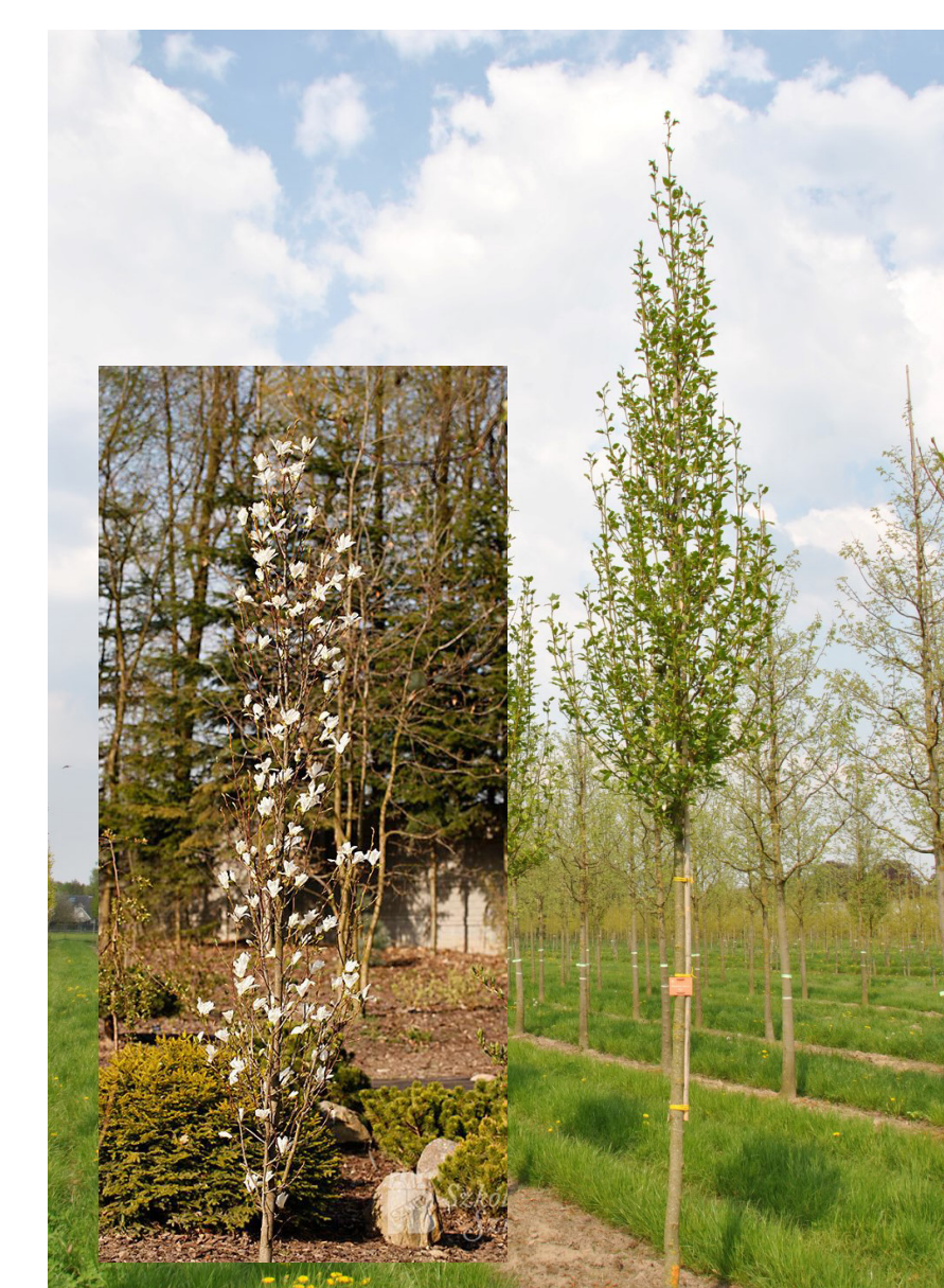
Magnolia kobus 'Isis'

Hoogte: 8-10 meter Kroonvorm: zuilvormig Bloei: crèmewit, bloeitijd maart Vruchten: rode vruchten Boomvorm: kan als hoogstamboom