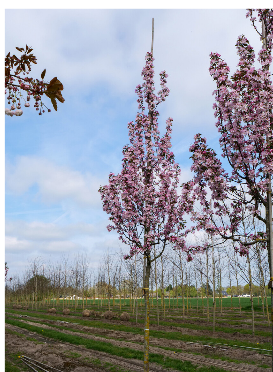
Malus 'Red Obelisk' (sierappel)

Ook hebben alledrie de soorten een mooie bloei in het voorjaar en zijn het geschikte 'straatbomen'. Dat betekent dat het wortelgestel tegen verharding kan. Doordat de bomen klein blijven en ze een goed plantvak krijgen, zal vrijwel geen wortelopdruk ontstaan (zoals in de huidige situatie wel het geval is).