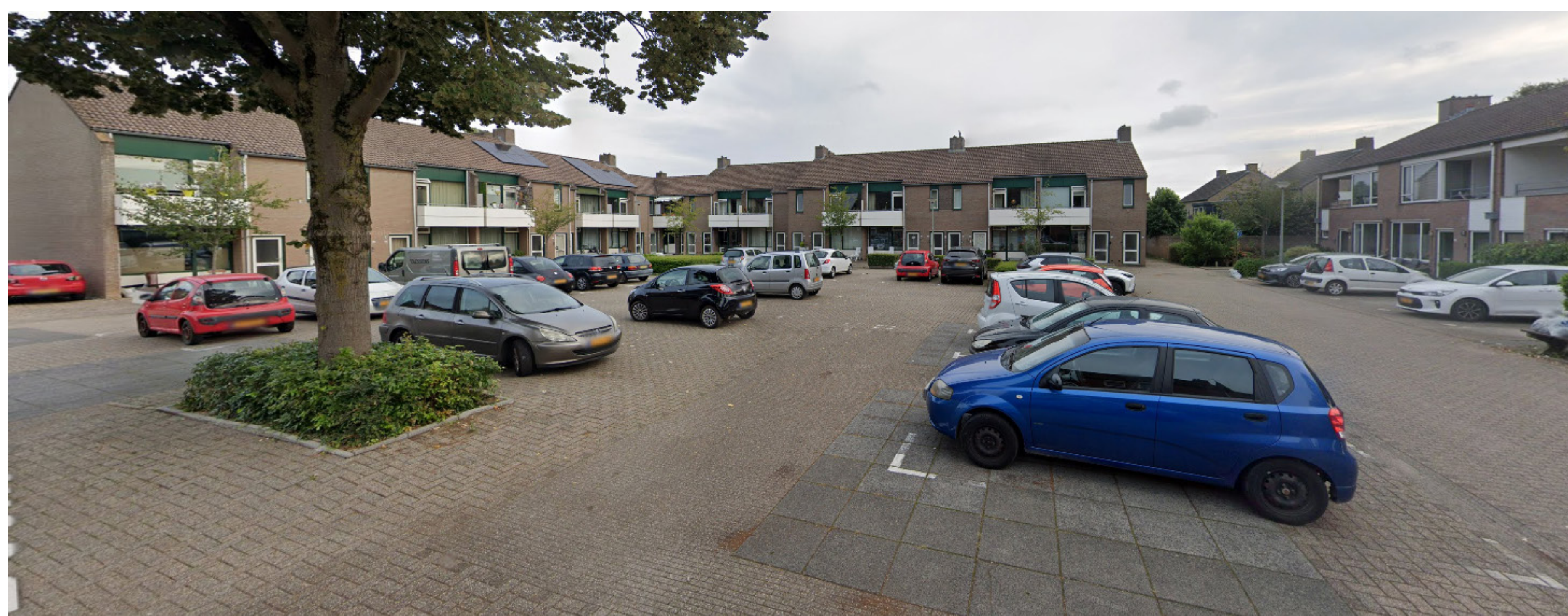
2 boven huidig beneden, sfeerimpressie