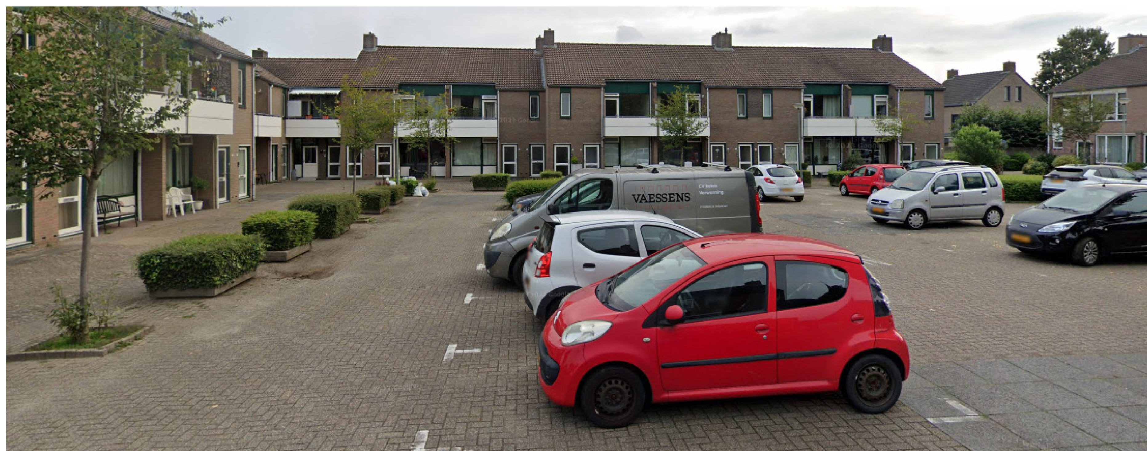
1 boven huidig beneden, sfeerimpressie