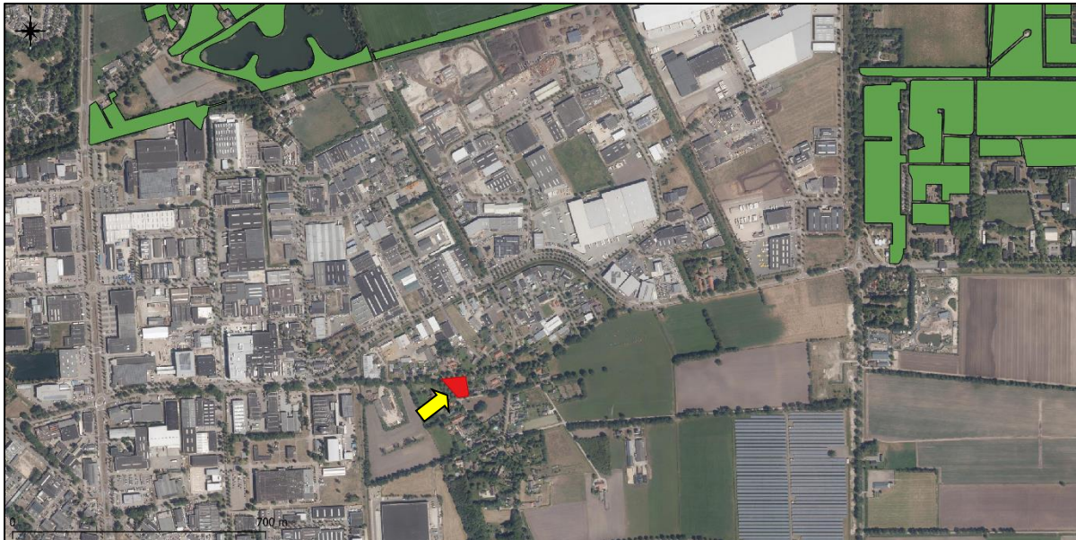
Figuur 7. Ligging onderzoekslocatie ten opzichte van het Natuurnetwerk Nederland.

De onderzoekslocatie maakt geen deel uit van het Natuurnetwerk. De onderzoekslocatie ligt ook niet in de nabijheid van een gebied, behorende tot het Natuurnetwerk Nederland. het meest nabijgelegen gebied bevindt zich op circa 900 meter ten noorden van de onderzoekslocatie. In figuur 7 is de ligging van de onderzoekslocatie ten opzichte van het Natuurnetwerk Nederland weergegeven.