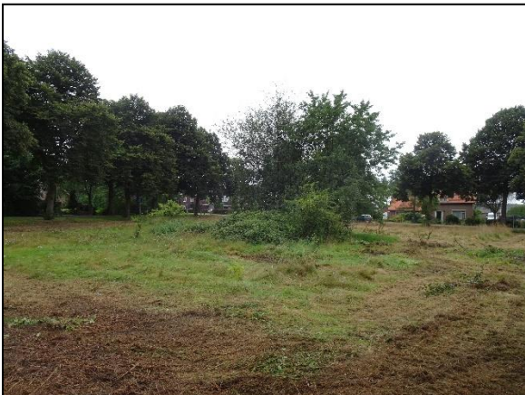
Figuur 3. Overzicht onderzoekslocatie, foto is in noordwestelijke richting genomen.