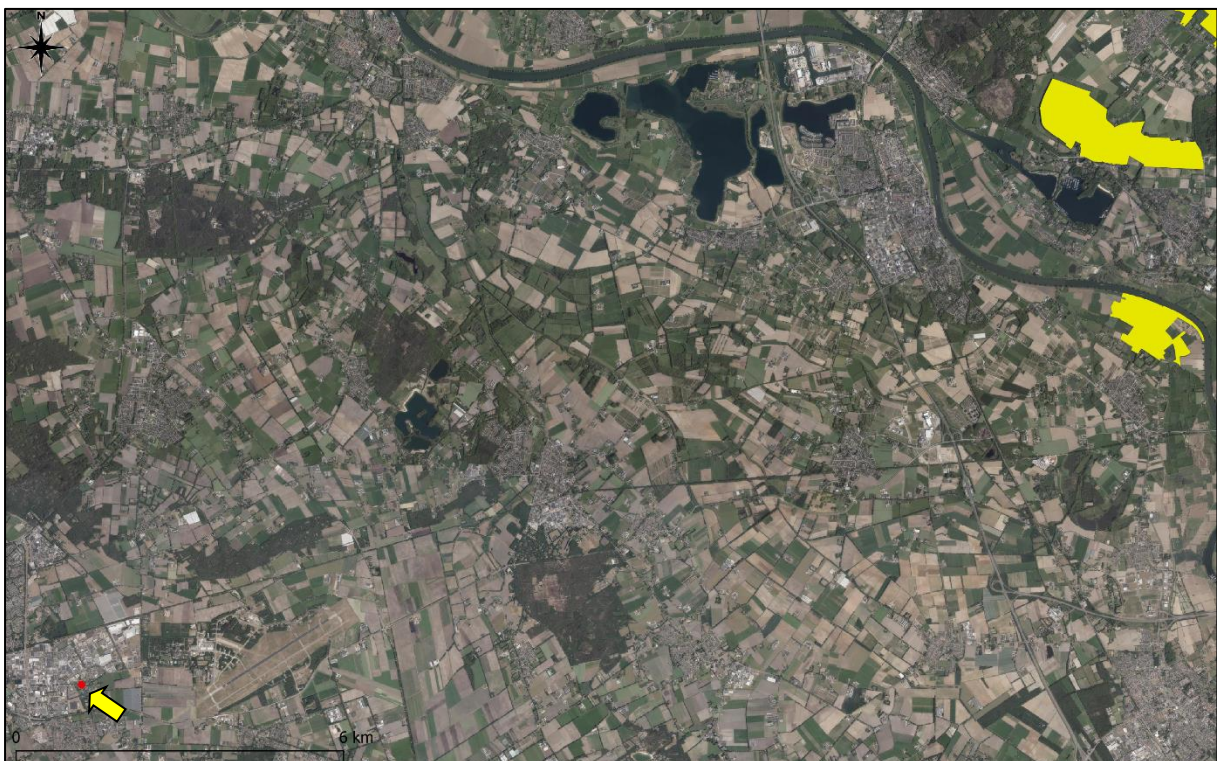
Figuur 6. Ligging onderzoekslocatie (rood vlak) ten opzichte van Natura 2000 (geel vlak).

De onderzoekslocatie is niet gelegen binnen de grenzen, of in de directe nabijheid van een gebied dat aangewezen is als Natura 2000. Het meest nabijgelegen Natura 2000-gebied, 'Oeffelter Meent', bevindt zich op circa 20 kilometer afstand ten noordoosten van de onderzoekslocatie (figuur 6).