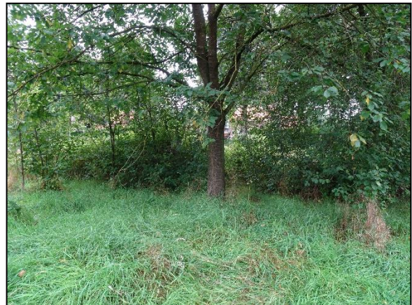
Figuur 4. Bosje op onderzoekslocatie.