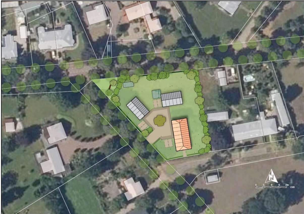
Figuur 5: Schetsontwerp onderzoekslocatie

De initiatiefnemer is voornemens de bestemming te wijzigen naar 'wonen' om vervolgens een aantal woningen te realiseren, ook wordt een deel van het perceel verhard, hiervoor zal het groen op de onderzoekslocatie worden verwijderd of aangepast (figuur 5).