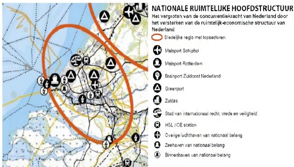
Figuur 5 – Nationale ruimtelijke hoofdstructuur; uitsnede Structuurvisie Infrastructuur en Ruimte

Voor een aanpak die Nederland concurrerend, bereikbaar, leefbaar en veilig maakt, moet het roer in het ruimtelijk en mobiliteitsbeleid om. Er is nu te vaak sprake van bestuurlijke drukte, ingewikkelde regelgeving of een sectorale blik. Daarom brengt het Rijk de ruimtelijke ordening zo dicht mogelijk bij diegene die het aangaat (burgers en bedrijven) en laat het meer over aan gemeenten en provincies ("decentraal, tenzij..."). Dit betekent minder nationale belangen en eenvoudiger regelgeving.