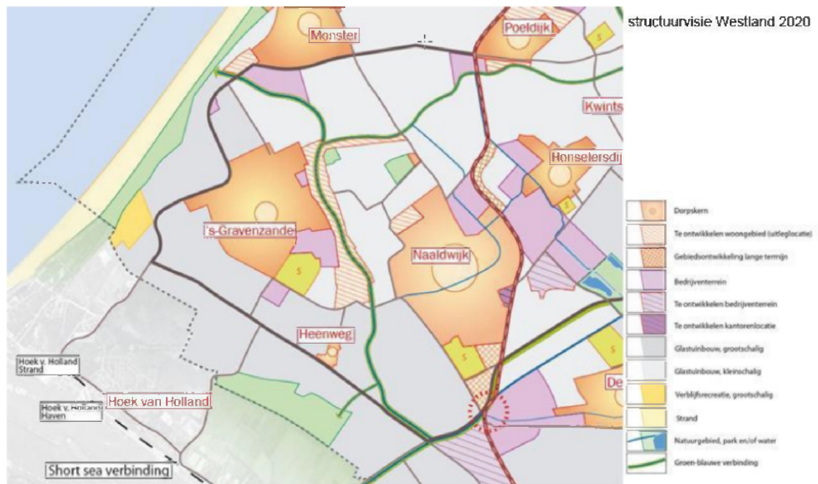
Figuur 2 - Uitsnede leefbaarheidskaart Structuurvisie Westland 2025

De groenblauwe hoofdstructuur van Westland bestaat uit de kust, de Poelzone, de Zwethzone, de Westlandse Zoom, de Gantel en de Blakervaart, die voor mens en dier een reis door Westland aantrekkelijk maken. De stepping stones Staelduinse Bos, Wollebrand, Plas van alle Winden en Prinsenbos vormen de hoofdstructuur, die de kust aan de Hof van Delfland binden.