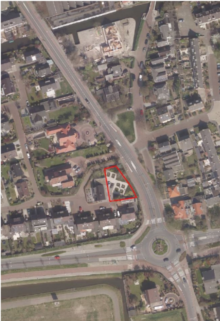
Figuur 1. Afbeelding plangebied.

Het plangebied ligt in Naaldwijk en wordt begrensd door de Secretaris Verhoeffweg aan de oostzijde, de Schepen in het zuiden en de Baljuw in het westen.