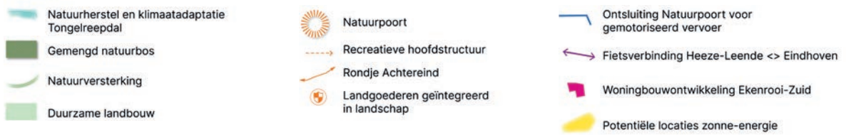
Figuur 3: Visiekaart