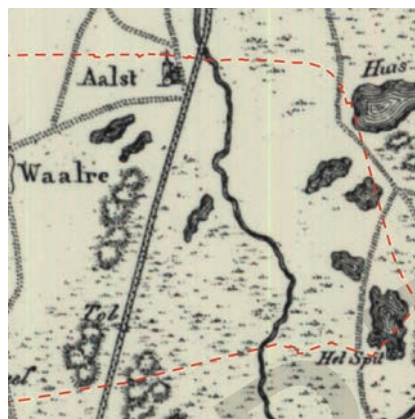
Buitengebied van Aalst in 1815

Op de kaarten is te zien hoe het buitengebied in de afgelopen twee eeuwen sterk is veranderd. De kernen zijn gegroeid en heide heeft plaatsgemaakt voor bos. Tegelijkertijd zijn de oude structuren, zoals de weg van de postkoets en de wegen in het Achtereind, nog goed zichtbaar. Deze oude structuren en invulling van het gebied zijn van belang om in ogenschouw te nemen bij toekomstige ontwikkelingen.