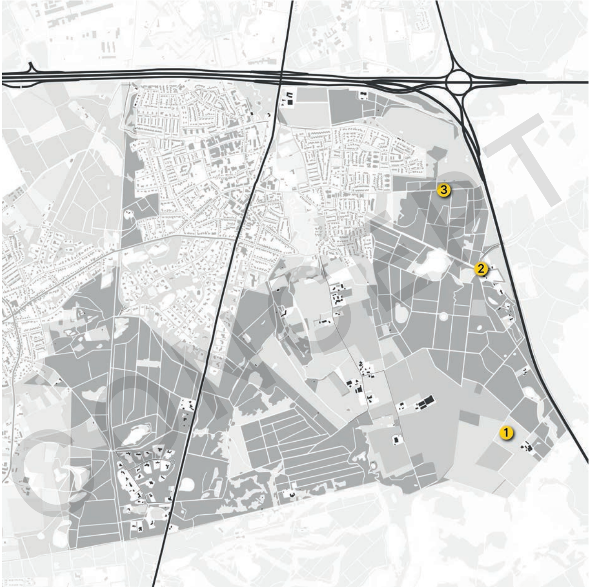
Figuur 4: Projectenkaart