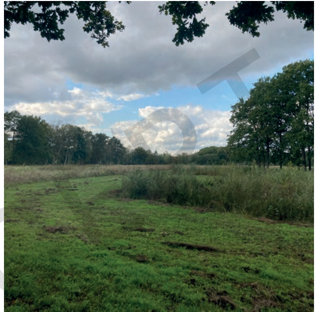
Overgangzone beekdal en bosgebied