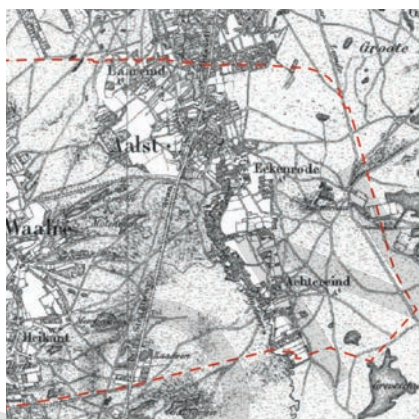
Buitengebied van Aalst in 1850