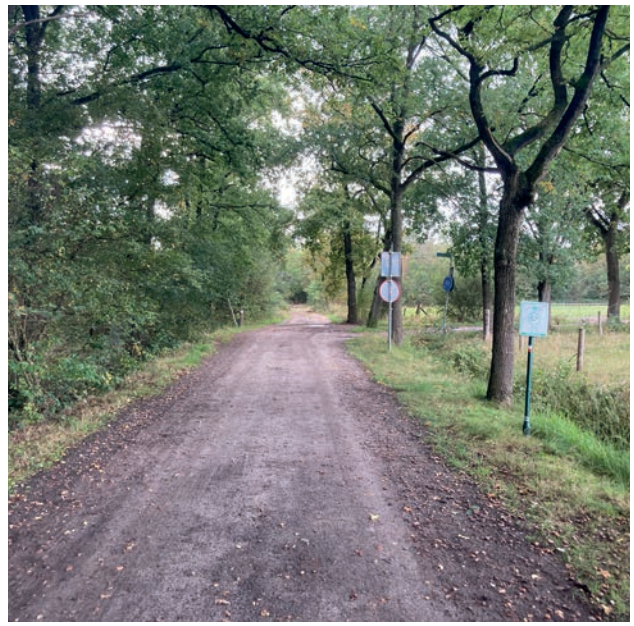
Paden in het Achtereind