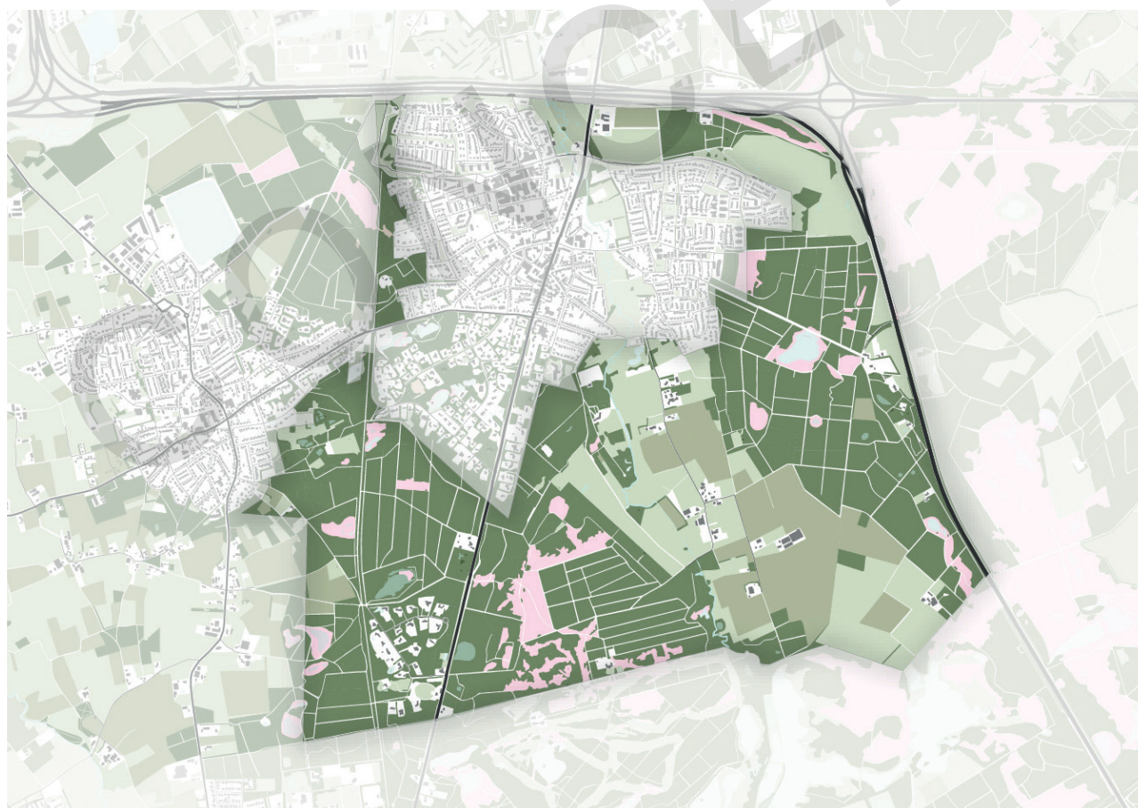
Figuur 1: De contouren van het ontwikkelperspectief van het buitengebied van Aalst

Omdat dit project gekoppeld is aan de omgevingsvisie zijn in de zomer en najaar van 2020 dezelfde fasen doorlopen als in het omgevingsvisie traject, namelijk Dromen, Denken, Durven, Doen. De observaties, dromen en ideeën die leven in het gebied zijn opgehaald aan de hand van diepte-interviews met belangrijke stakeholders en een enquête die is uitgezet binnen de gemeente (344 respondenten). Ze zijn samengevat in de notitie 'Dromen, opgaven en kansen'. Ook is in de eerste fase bestaand beleid tegen het licht gehouden.