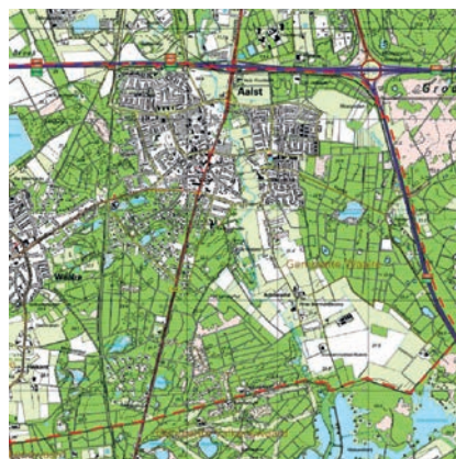
Buitengebied van Aalst in 2000