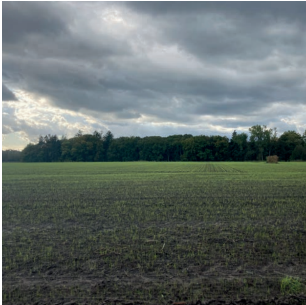
Akkergronden in het Achtereind