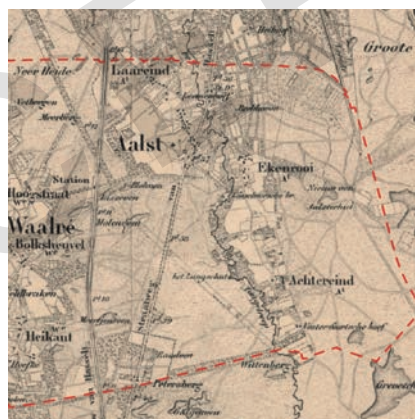
Buitengebied van Aalst in 1900