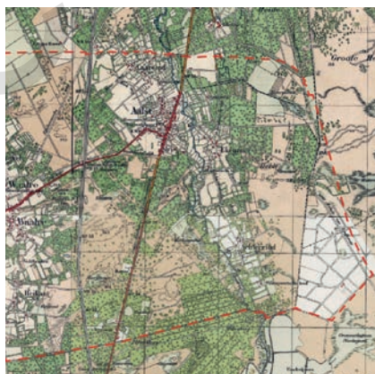
Buitengebied van Aalst in 1950