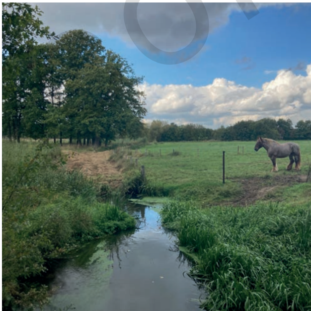
Beekdal de Tongelreep