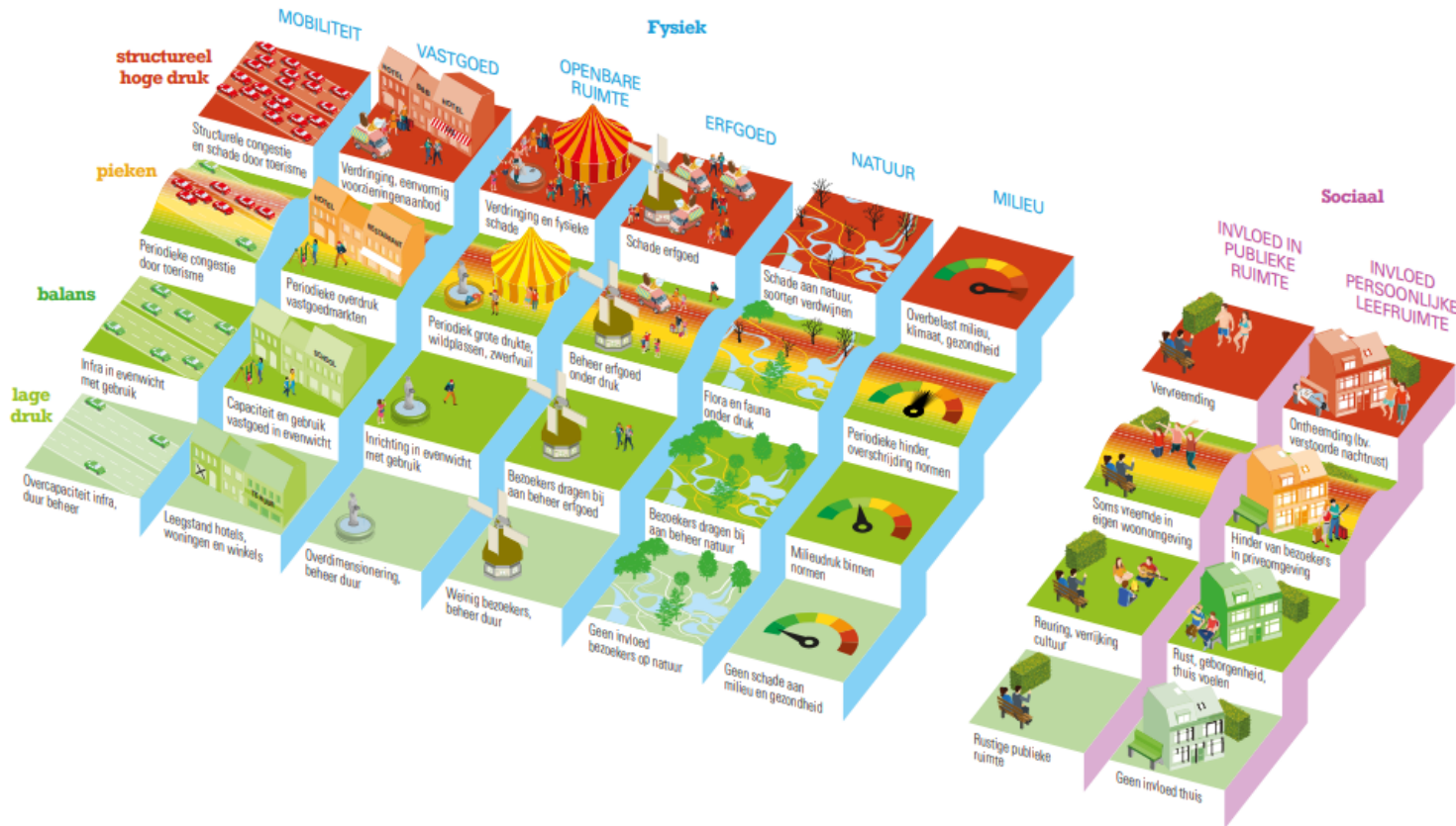
Figuur 3: Beoordeling effecten toerisme op de leefomgeving en samenleving

Doel: impact VTE op leefomgeving en samenleving in kaart brengen