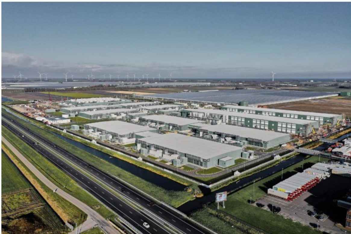
Overzicht situatie Datacenter Middenmeer 70 ha