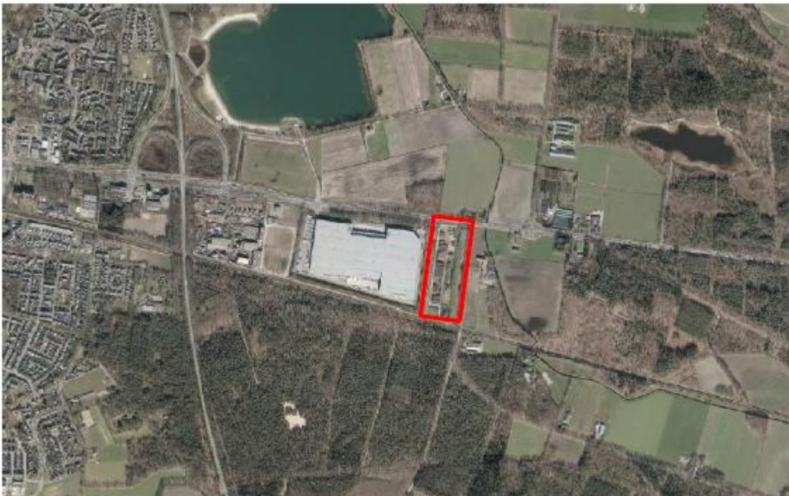
Figuur 1: duiding van de locatie aan Helmondsingel 131. De locatie is rood omljnd.

Het drogen van GFT- en andere organische afvalstoffen past niet binnen de gebruiksregels van het geldende bestemmingsplan. De te realiseren schoorsteen en geluidsschermen passen niet in de bouwregels van het bestemmingsplan.