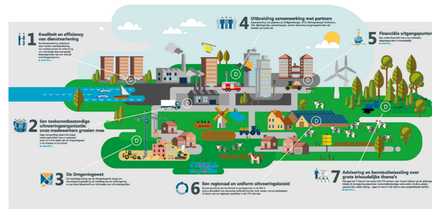
Figuur 1: infographic Concernplan Omgevingsdienst Zuidoost-Brabant