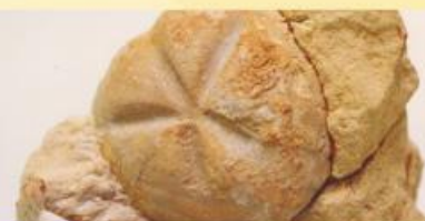
Zee-egel uit de fossielencollectie

bouwsteen in de bovenzaal en kijk naar een interessante film. In het museum is ook altijd plaats voor het verleden van deze regio. Een thema-expositie over een belangrijke historische gebeurtenis