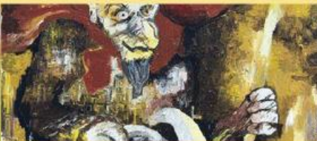
Harry Peerboom, Bokkenrijder

In de benedenzalen van het museum worden jaarlijks minstens vier grote tentoonstellingen gehouden, zowel solo- als groepsexposities. Of thematentoonstellingen die verband houden met de actualiteit of historie van deze streek.