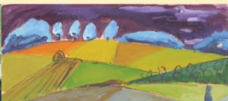
Guillaume Stassen, Landschap

De bovenverdieping is het terrein van hedendaagse kunstenaars, met vaak verrassend werk. Wellicht is een van hen aanwezig om met bezoekers over zijn of haar werk te praten.