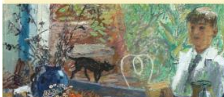
Charles Eyck, Ragnar in atelier Ravensbos

In de loop van de middeleeuwen werd Valkenburg een stadje met een unieke hoogteburcht en vestingwerken. In de 19e en 20e eeuw is de burcht een ruïne die een prachtig uitzicht over de streek biedt. Het oude vestingstadje is gerestaureerd en zeer in trek bij toeristen.