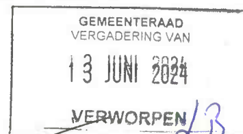
Ellen Verkoelen 50PLUS