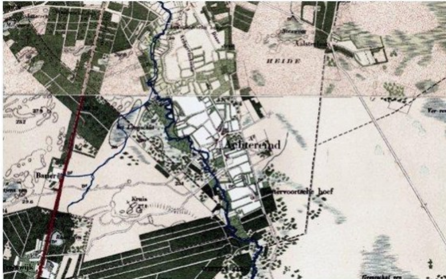
Topografische kaart van 1927.

Dat ven dat maar op één kaart vol water staat, is niet in de erfgoedkaart onder de vennen opgenomen. De Raadvenloop slingerde er dwars doorheen.