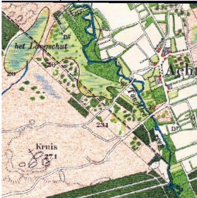
Topografische kaart van 1901.

De topografische kaart van 1901 geeft een langgerekte drassige graslaagte aan ter plaatse van het ven uit 1845, zonder sloten. De naam Het Langschut is nu bij die natte laagte gezet. De beek stroomt er in uit, er is geen afwatering naar de Tongelreep. Onder Aalst aan de Tongelreep moerassige graslanden onverkaveld, maar met een gegraven uitwatering (met twee duikers) op de Tongelreep. Pal aan die beek bospercelen. Pal langs heel de gemeentegrens de strook van ongeveer 60 meter breed die verkaveld is, maar nog als met bosschages dichtgroeïende heide staat aangegeven. De twee dennenbosjes zijn er niet meer.