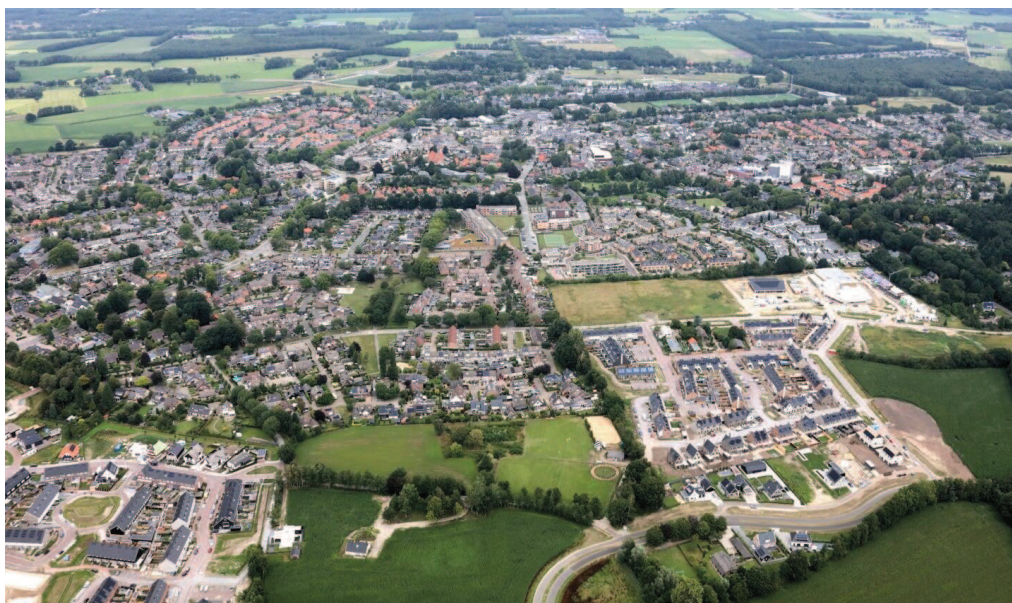
Luchtfoto van Voorthuizen uit juli 2020.

Vergelijk: De Euromast in Rotterdam is 185 m hoog.