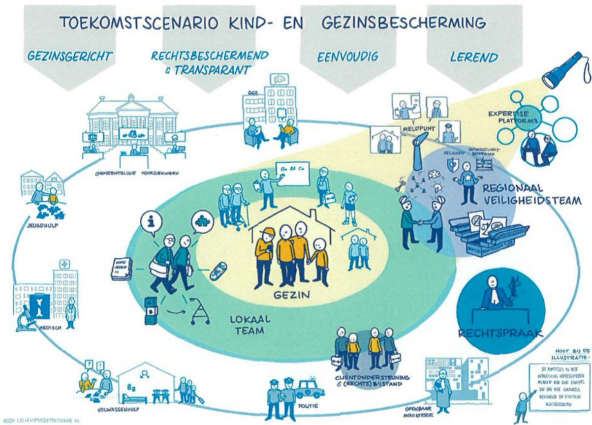
Afbeelding 1 - Toekomstscenario in beeld