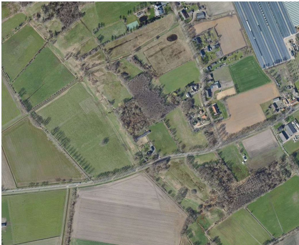
• Afbeelding 1: luchtfoto plangebied

Het plangebied ligt in de plaats Uden in de gemeente Maashorst. Het plangebied bevindt zich buiten de verkeerskundige en stedenbouwkundige bebouwde kom van Uden.