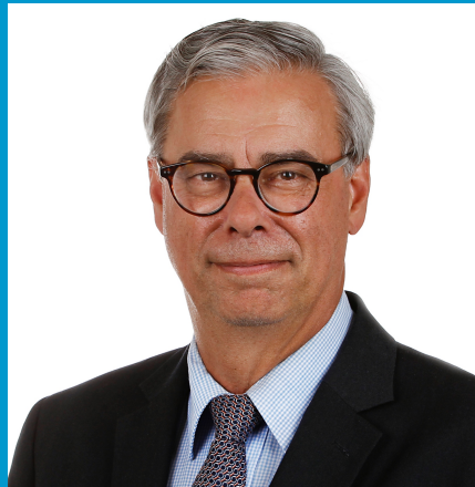
Burgemeester gemeente Waalre Voorzitter basisteam Kempen

De zorg voor veiligheid is een kerntaak van de gemeente. Die verantwoordelijkheid dragen we samen met vele partners. Veiligheid is veel omvattend en gaat om zaken waar inwoners dagelijks (bewust en onbewust) mee te maken krijgen. Denk daarbij aan veiligheid tijdens grote evenementen of de wetenschap dat de brandweer op tijd arriveert bij een brand, maar ook vervelende zaken zoals fietsendiefstal, woninginbraak, geweldpleging of de verwevenheid van de onderwereld met de bovenwereld. Veiligheid is een basisvoorwaarde voor een aantrekkelijke woon-, werken leef- gemeente en voor een goede economische en sociale ontwikkeling. De gemeente moet niet alleen veilig zijn, inwoners moeten zich ook veilig voelen.