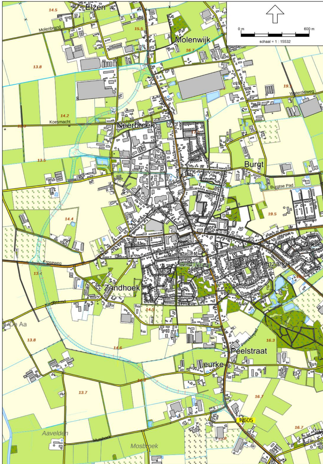
Figuur 3.1: situering plangebied