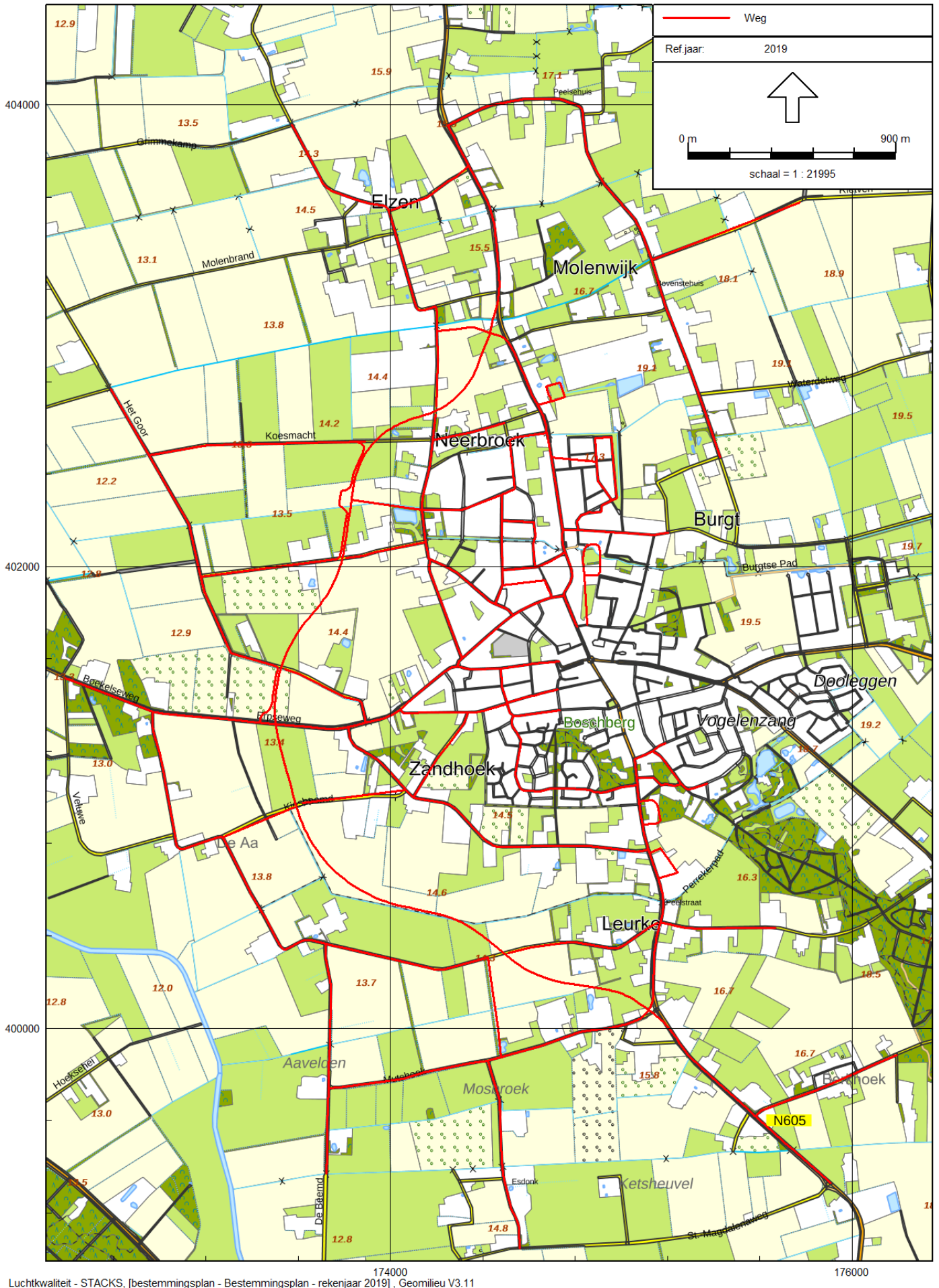
Figuur 1: Grafische weergave rekenmodel - wegen