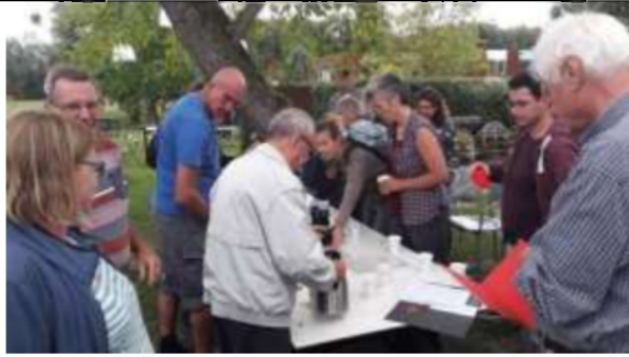
De catering was prima