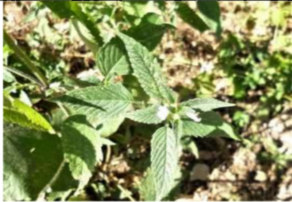
06/08, hennepnetel spec. , van Weerden Poelmanpad, Jos van Koppen.