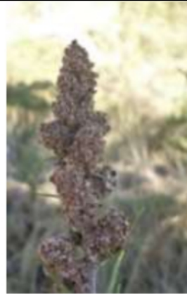
06/08, uitgebloeide bijvoet , van Weerden Poelmanpad, Jos van Koppen.