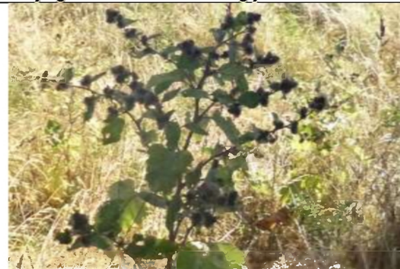
06/08, schaduwbeeld gewone klit , van Weerden Poelmanpad, Jos van Koppen.

Als je geen account hebt mag je het melden via knnvdelft en zaterdag.