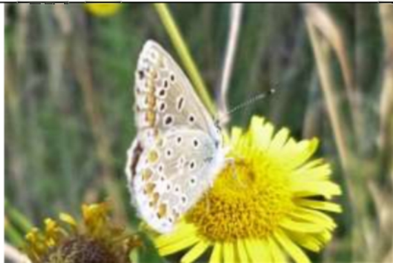
06/08, vrouwtje Icarusblauwtje op heelblaadjes , van Weerden Poelmanpad, Jos van Koppen.