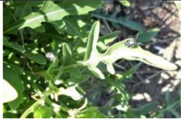
06/08, koolwantsen , van Weerden Poelmanpad, Jos van Koppen.