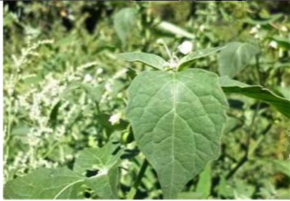
06/08, nachtschade op melde , van Weerden Poelmanpad, Jos van Koppen.