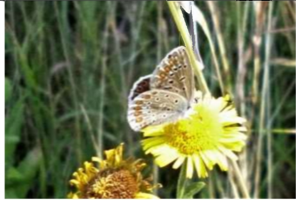
06/08, icarusblauwtje vrouwtje op heelblaadjes , van Weerden Poelmanpad, Jos van Koppen.