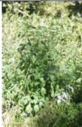
06/08, melde , van Weerden Poelmanpad, Jos van Koppen.