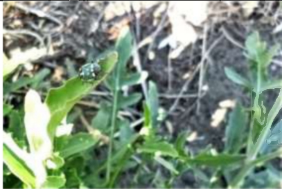
06/08, koolwants , van Weerden Poelmanpad, Jos van Koppen.