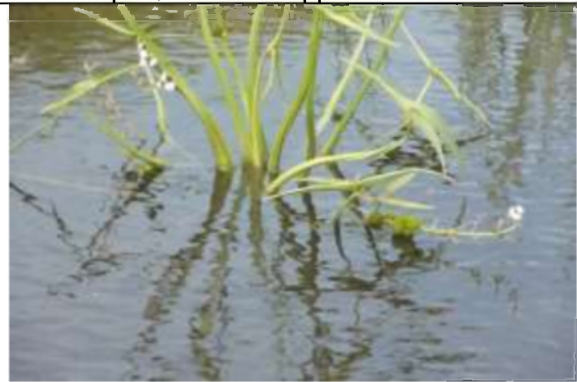
12/08, bloeiend pijkruid , Tanthof, Freek Boon.