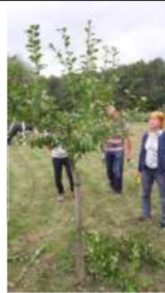
Een peer na het snoeien