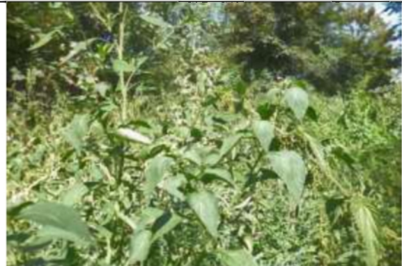
06/08, nachtschade in melde , van Weerden Poelmanpad, Jos van Koppen.