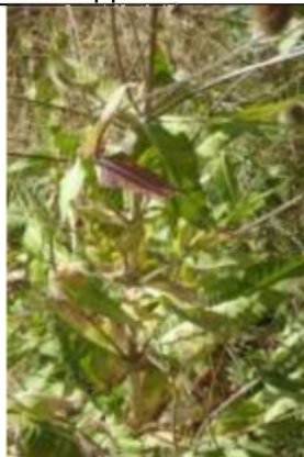
12/08, hangende kaardenbol , Kenenburgpad, Freek Boon.