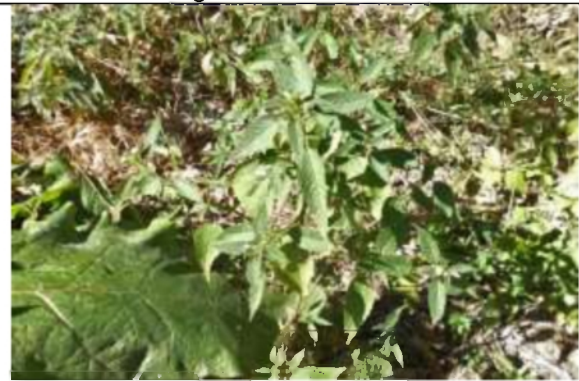
06/08, hennepnetel sp. van Weerden Poelmanpad, Jos van Koppen.