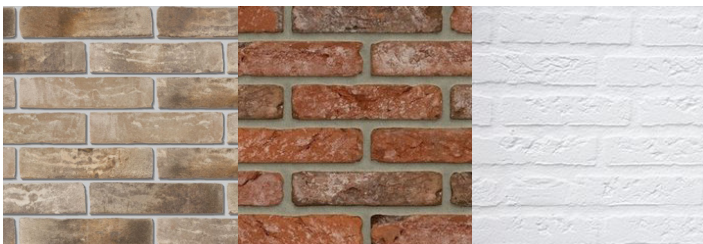
Bruin-rode baksteen of wit gekeimde baksteen