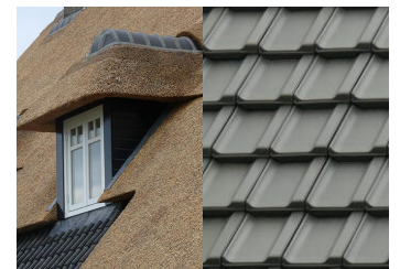
Rieten kap, keramische zwarte dakpan